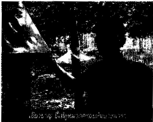
เอียนายู เป็นลูกหมวกครอบต้นยางพารา