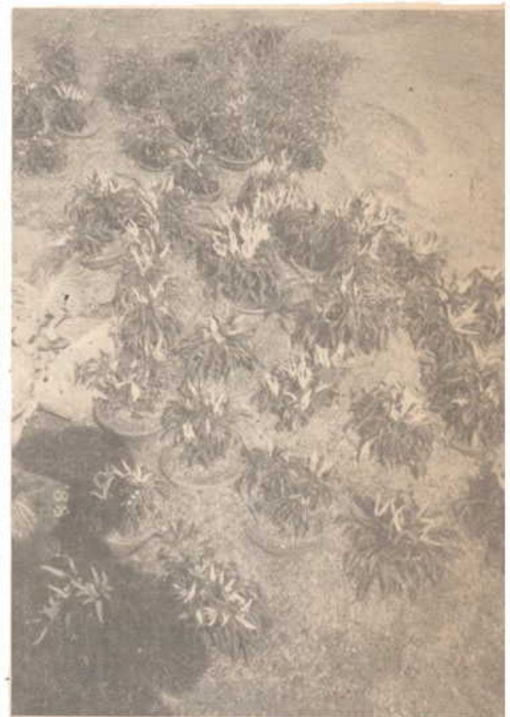
พริกแฟนซี จากใต้หวันที่นำมาปลูกที่เชียงใหม่ ให้ผลเป็นที่น่าพอใจ