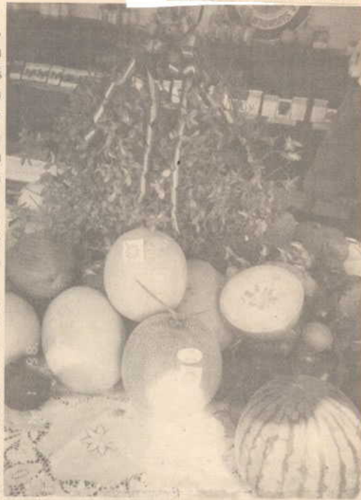
ผลแตงแคนตาอู สิดตรา กรป. กลาง อ. จอมทอง ซึ่งเป็นผลิตผลของ "โครงการเกษตรกรรม กรป. กลาง"

อย่างไรก็ตาม สำหรับแตงพันธุ์นี้เป็นพืชที่ต้องการดูแลเอาใจใส่และบำรุงรักษาเป็นพิเศษ นอกจากนั้นต้องใช้เทคโนโลยีสมัยใหม่เข้าช่วยด้วยหลายอย่าง จึงจะสามารถให้ผลผลิตออกมาที่ดี ดังนั้นจะเห็นได้ว่า แม้ว่าแตงพันธุ์