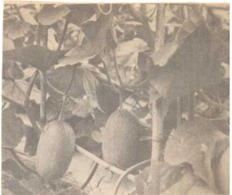
แตงแคนตาอูปลูก พันธุ์สุกายลือกเกิดที่ อ. ขอมทอง ร. เชียงใหม่

บางรายคงไม่เอาใจใส่เท่าที่ควร ผลผลิต จึงไม่ดี เวลาที่เราศึกษาหาพันธุ์พืช ต่าง ๆ ที่คิดว่าปลูกในเชียงใหม่แล้วให้ ผลผลิตที่ดี ก็จะทดลองนำพันธุ์มาปลูก เหมือนอย่างที่เป็นงานฤดูทกทั่วที่ จ. เชียงใหม่ เอาต้นแตงแคนตาอูปลูกมาจำหน่ายต้นละ 5 บาท และนำผลผลิตผลแตงแคนตาอูปลูกพันธุ์ ต่าง ๆ มาโชว์ให้ประชาชนชม แต่ไม่มี การจำหน่าย ในด้านวิชาการ เรายินดีให้ การสนับสนุนทุกหน่วยงานที่ได้ติดต่อ มา เรายินดีไปแนะนำบริการทุกโครง การที่ขอมา ไม่ว่าจะป็นภาครัฐบาล หรือว่าภาคเอกชนก็ตาม ใครที่คิด จะปลูกแตงพันธุ์ต่าง ๆ จากใต้หวัน ไปติดต่อที่บริษัท เพื่อนเกษตรกร จำกัด ที่ จ. เชียงใหม่ ได้ตลอดเวลา.