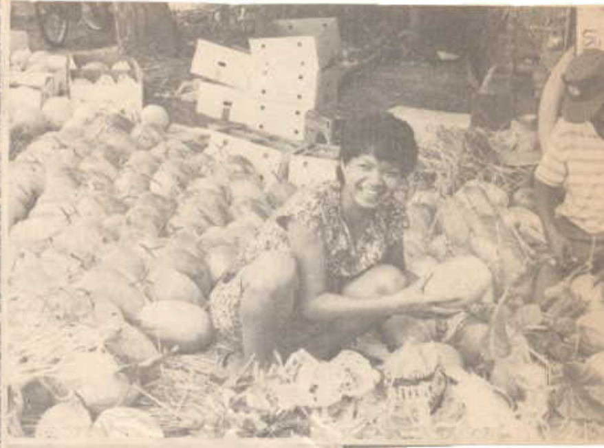
แต่งแทนตาสุป กำลิ่งกิตเพ็อนบรซุดงกต่อง ส่งลูกค้า