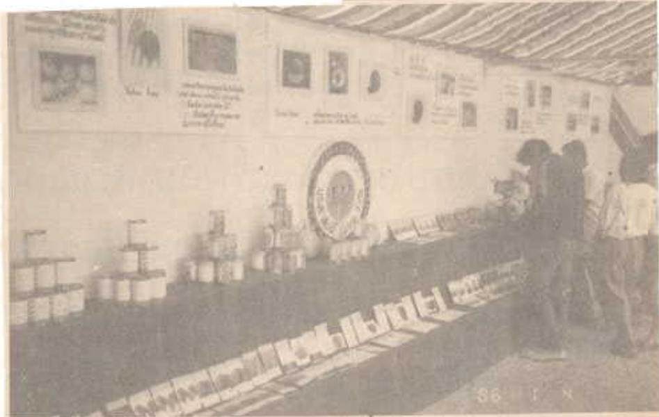
เมล็ดพันธุ์พืช ต่าง ๆ ที่จำหน่ายในงานฤดูหนาวจังหวัดเชียงใหม่ของบริษัทเพื่อนเกษตรกร จำกัด