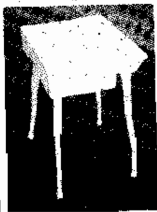
โต๊ะโซฟา