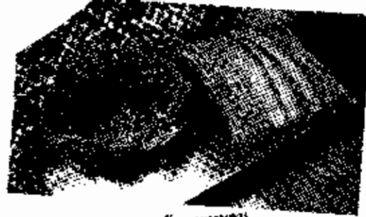
เศษหนึ่งสามเป็นตะกร้า และหมอน

ใครจะรู้ว่าขยะไร้ค่าในวันนี้อาจเป็นสมบัติในอีกวัน