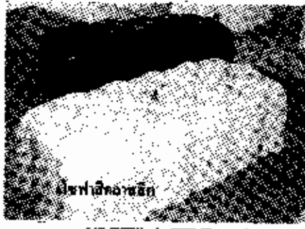
เบาะพนักเก้าอี้