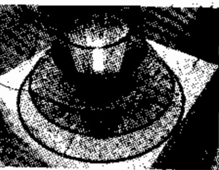
โคมไฟกลมสนพลาตติก