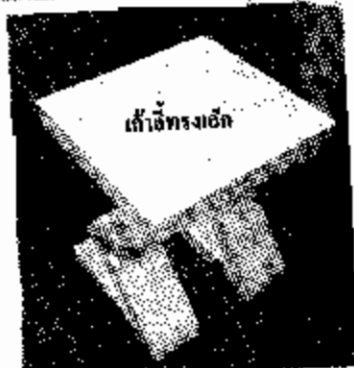
เก้าอี้ทรงอีก