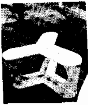
โต๊ะไม้สี่ขาของ