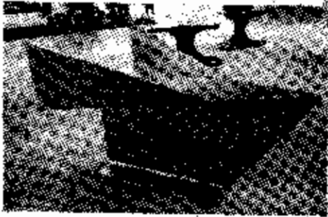
เก้าอี้ทรงจระเข้