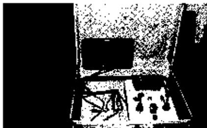
งบประมาณ งบไทยเข้มแข็ง จังหวัด

ชดกันไฟ ชดกันแรง ระเบิด ฝ่าคลุกกัน สะเก็ด ดึงเก็บเคลื่อนย้าย ระเบิด ปืนยิงน้ำแรงดันสูง และอุปกรณ์ที่จำเป็นต่อการเก็บ ทุ๋อีกมากมาย