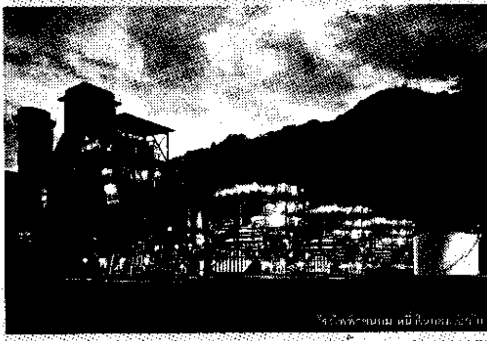
โรงไฟฟ้าชุมชน บริษัท ช.ป. จำกัด