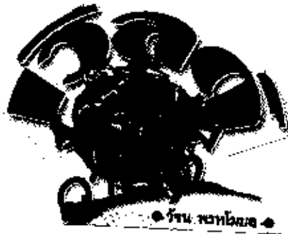
• วัน พงษ์ไชย •