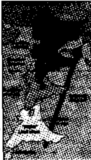
การเคลื่อนที่ของอนุทวีปอินเดีย ตามความเชื่อของนักวิทยาศาสตร์ในช่วงก่อนหน้านี้

อำพัน อัญมณีสีเหลืองใส มีต้นกำเนิดจากยางไม้ที่ไหลออกจากเปลือกเมื่อดันไม้ถูกรบกวน ยางไม้เหล่านี้มักจะไหลลงมาเพื่อเคลือบผิวนอกของต้นไม้และในบางครั้งยางไม้เหล่านี้ก็หุ้มแมลงชนิดต่างๆ แมงมุม หรือสัตว์ขนาดเล็กเอาไว้ ธรรมชาติใช้เวลานับล้านๆ ปีในการบ่มยางไม้เหล่านี้เป็นก้อนอำพันที่แข็งแกร่งเท่าๆ กับหิน นั่นทำให้ซากสัตว์ตัวเล็กๆ ที่อยู่ในอำพันยังคงอยู่ในสภาพที่สืราวกับเพิ่งตายใหม่ๆ ด้วยเช่นกัน