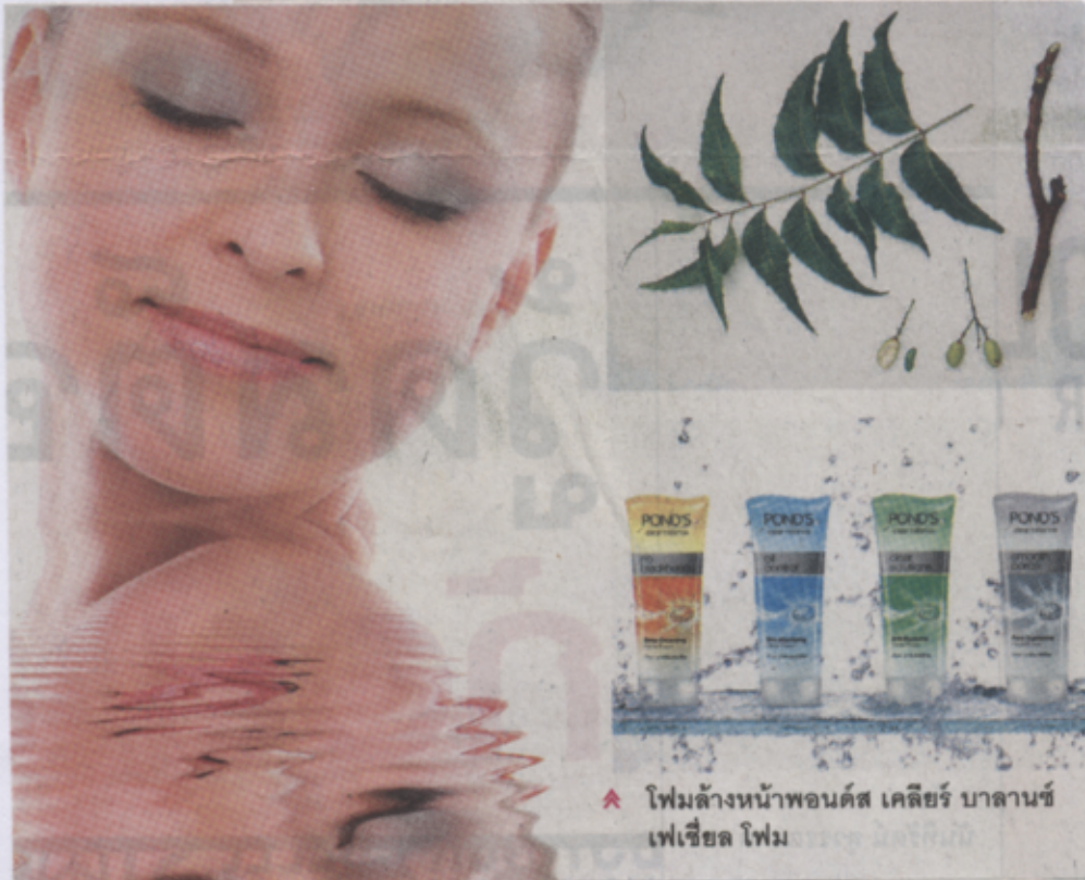
▲ โฟมล้างหน้าพอนด์ส เคลียร์ บาลานซ์ เฟเชียล โฟม