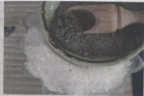
ข้อมูล : อาชีวนม เบอร์สันมาร์สเทลเลอร์

หลายประเทศในเอเชียตะวันออกเฉียงใต้ มีฉายาว่า ยาแห่งหมู่บ้าน ด้วยผู้คนแถบนี้เกิดและเติบโตมากับต้นสะเดา ไม่มียีนต้นที่ให้คุณประโยชน์ตั้งแต่รากสู่ใบ จนถึงเมล็ด ตำรับอายุเวทมีบันทึกการใช้สะเดามากกว่า 4,000 ปี ชาวอินเดียเรียกนิมว่า arista เป็นภาษาสันสกฤต หมายถึง perfect หรือสมบูรณ์แบบ บ้างเรียกว่า nimba แปลว่า ให้สุขภาพที่ดี แต่ละชื่อล้วนบอกความหมายถึงการใช้เพื่อบำบัดรักษา ส่วนคนไทยโบราณที่มักพูดว่า "หวานเป็นลม ขมเป็นยา" น่าจะหมายถึงผักสะเดาอยู่ด้วย จากธรรมชาติพบแต่กินได้ เป็นทั้งอาหารและยา ปัจจุบันมนุษย์ใช้น้ำมันสะเดาสกัดจากเมล็ดและใบ นำมาผ่านกระบวนการผลิตเป็นครีมบำรุงผิว เครื่องสำอาง และยา ใช้กันแพร่หลายตั้งแต่ดวงความสวยความงาม จนถึงใช้เป็นยารักษาโรคสารพัด ได้แก่ โรคผิวหนังชนิดต่างๆ แก้มแพ้ ใช้บรรเทาอาการข้างเคียงจากโรคเบาหวาน อดส์ โรคหัวใจ จนถึงมะเร็ง