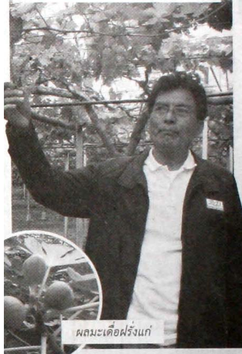
ผลมะเดื่อฝรั่งแก่

สามารถรองรับการเปลี่ยนแปลงสภาพภูมิอากาศ ที่อุณหภูมิบนพื้นที่สูงอาจจะร้อนขึ้น