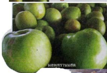
ผลพทรานมสด