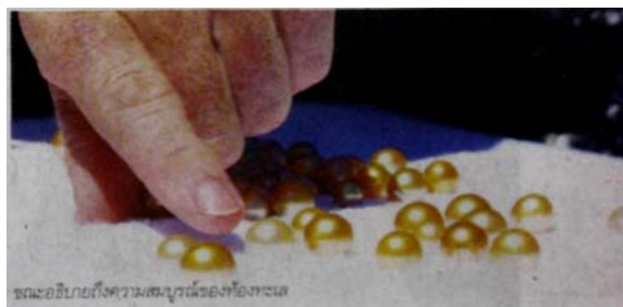
ขณะอธิบายถึงความสมบูรณ์ของไข่มุก

...เพราะสำหรับเขาแล้ว ‘สมาธิ’ มีอยู่ในทุกขณะจิต