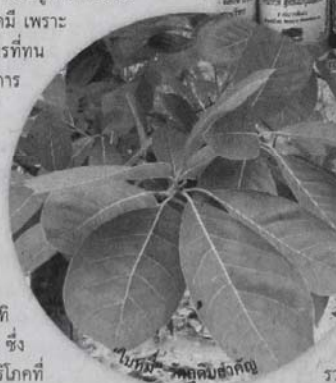
ใบหมี่ พืชสมุนไพร

ทว่าด้วยวิสัยทัศน์ที่ไกลกว่านั้นในทันทีที่กว่า 200 ไร่ ที่ จ.บุรีรัมย์ และจ.สุรินทร์ โดยปลูกในลักษณะ เป็นพืชอินทรีย์ ปลอดจากสารเคมี เพราะ ธรรมชาติของต้นหมี่เป็นสมุนไพรที่ทน ต่อโรคต่างๆ ได้ดี ที่สำคัญจากการ ทดสอบของนักวิจัยจากหลาย ประเทศ ให้การยอมรับว่าเป็น พืชที่ทรงคุณค่าสำหรับเส้นผม ดังนั้นจินดาสมุนไพรจึงเป็น เจ้าแรกเจ้าเดียวในโลกที่นำพืช ชนิดนี้มาพัฒนาต่อยอดเป็นผลิตภัณฑ์เพื่อเส้นผม และมีผลิตภัณฑ์ออกมาแล้ว อาทิ แชมพู ครีมนวด เซรั่มบำรุงผม ซึ่ง เหล่านี้ได้รับการตอบรับจากผู้บริโภคที่ ต่างกว่าในคุณภาพของใบหมี่ได้เป็นอย่างดี