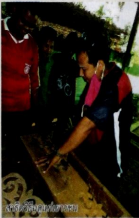
สตรีคิดวิธีผลิตที่เขาคอกหม

โดยมีชุมชนที่ได้รับทุนจาก สสค.4 พื้นที่คือเทศบาลเมืองสะเตงนอก เสนอโครงการฟาร์มเกษตรตัวอย่างครบวงจร อบต.บาลอ เสนอโครงการส่งเสริมการเรียนรู้และเพิ่มทักษะการประกอบอาชีพการเลี้ยงโคขุน อบต.พร้อม เสนอโครงการพัฒนาการเรียนรู้เพื่อ