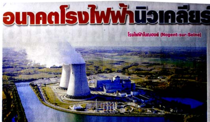
โรงไฟฟ้านิวเจนต์ (Nogent-sur-Seine)

ฉบับที่ 23,317 วันพฤหัสบดีที่ 15 สิงหาคม พ.ศ. 2556 หน้า 2