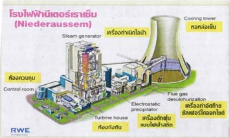
โรงไฟฟ้านิวเดอราเซม (Niederaussem)

เมื่อต้นคริสต์ทศวรรษ 1950 โรงไฟฟ้านิวเดอราเซม (Fortuna IV) มีกำลังผลิต 900 เมกะวัตต์ ครอบคลุมโดยเทคโนโลยี 3 แกนยูเรเนียม โรงไฟฟ้านิวเดอราเซมมีกำลังผลิต 1,100 เมกะวัตต์ และใช้เทคโนโลยีเครื่องปฏิกรณ์แบบน้ำแรงดันสูง (DWR) ซึ่งใช้เทคโนโลยีที่เรียกว่า 'เครื่องปฏิกรณ์แบบน้ำแรงดันสูง' เพื่อให้ความร้อนแก่เครื่องกำเนิดไฟฟ้า โดยไม่ต้องใช้สารทำความเย็นที่เป็นพิษ