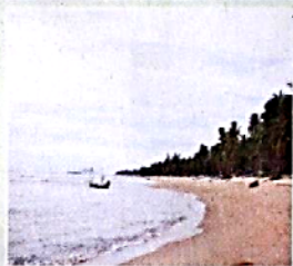
♦ ชายหาดพระนครที่ทับสะแก