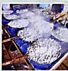
♦ โรงงานแปรรูปมะพร้าวที่ตำบลนารม