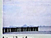
♦ สะพานอ่าวชุมตาในทะเล