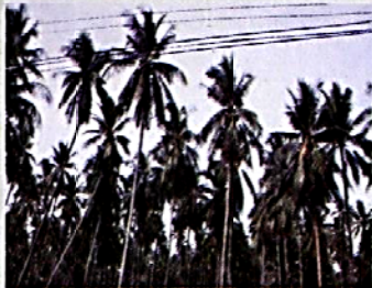
♦ สวนมะพร้าวเมืองนารมเก่า 100 ปี ที่ทับสะแก

ภูมิบ้าน ภูมิเมือง โดย : พลาศีย์ สิกขธัญญา Paladisai@siamreccorder.com การเดินทางท่องเที่ยวทำให้เกิดการ เรียนรู้เห็นแจ้งจริงเสียแล้วใน คราวนี้ อาทิตย์คุณปัญญา โกรทักคน จากกรมการท่องเที่ยว ขวไปอำเภอ ทับสะแก เมืองประจวบคีรีขันธ์ ก็นึก ไม่ออกว่าที่นั่นจะมีอะไรสำคัญ แม้จะ ค้นหาคำตอบอย่างไรก็หาไม่เจอที่ไหน นอก ที่เพิ่งประกาศตั้งเมื่อวันที่ 23 กรกฎาคม พ.ศ.2501 หลังจากที่ตั้งและแถบนี้ยังอ้างเอา มามานานแล้วตั้งแต่ พ.ศ.2481 เดิมเป็น เป็นพื้นที่อยู่ในเขตเมืองประจวบคีรีขันธ์ ที่มีหน้าที่จัดการอ่าวไทยคู่กับเมือง ประจวบคีรีขันธ์ ปัจจุบันคือเกาะแก่ง ในอ่าวชุมตา ด้วยเหตุที่เป็นชุมชนชายเล มีพื้นที่เป็นอ่าวอยู่ด้านตะวันออกซึ่ง มีความยาวไกลไปถึงอำเภอบาง ตะพาน อันเป็นแหล่งแหล่งทำสำคัญใน อดีตนั้น ทับสะแกจึงถูกมองเป็นหมู่บ้าน ชายทะเลธรรมดาอยู่ตรงกลางในแนว หาดทรายเดียวกับอ่าวประจวบคีรีขันธ์ ซึ่งมีผู้เรียกว่า หาดพระนคร จาก ข้อมูลในพงศาวดารว่า เมื่อเสร็จสิ้นการ ศักสงครามนั้น พระนครวัดได้โปรดให้ โพร่งพลของพระองค์ลงมาพักผ่อนที่ หาดทรายชายทะเลแห่งนี้ ในสมัยอยุธยา นั้นมีชื่อเมืองในพื้นที่ว่า "เมืองนารัง" หรือ "เมืองบางนารม" ในคำให้การ