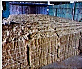
♦ เมื่อก่อนมะพร้าวที่ตำบลนารมเป็นสินค้าส่งออก