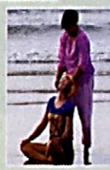
♦ ชายหาดพระนครที่ทับสะแก