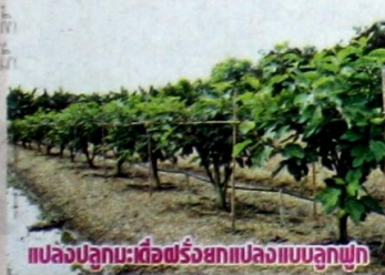
แปลงปลูกมะเดื่อฝรั่งยกแปลงแบบปลูกฝัก