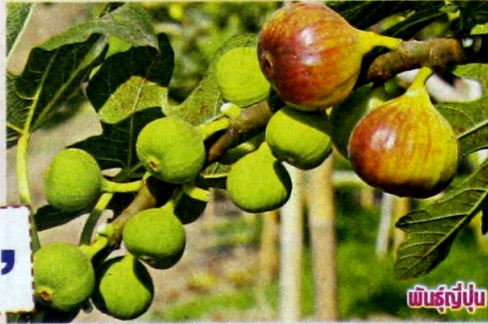
พันธุ์ญี่ปุ่น

สุขภาพ ที่สำคัญมะเดื่อฝรั่งเป็นผลไม้ที่ไม่มีธาตุโซเดียมและคอเลสเตอรอล ในการโฆษณาขายมะเดื่อฝรั่ง ในต่างประเทศจึงมักใช้สโลแกนเป็นภาษาอังกฤษว่า “No Sodium No Cholesterol” สำหรับผู้ป่วยที่เป็นโรคความดันโลหิตสูงและมีปริมาณไขมันใน