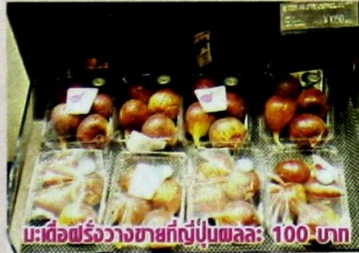
มะเดื่อฝรั่งวางขายที่ญี่ปุ่นผลละ 100 บาท

ขยายพื้นที่ปลูกมะเดื่อญี่ปุ่นและพันธุ์รวาน์จอร์เจีย จนมีผลผลิตออกส่งขายตลาดได้เฉลี่ยจากสวนกิโลกรัมละ 100 บาทและมีผลผลิตออกได้ทั้งปี มะเดื่อฝรั่งจัดเป็นผลไม้แปลกและหายากที่น่าสนใจและคนที่ขยายพื้นที่ปลูกใหม่จะเริ่มให้ผลผลิตหลังจากปลูกไปได้เพียง 6 เดือนเท่านั้นและที่สำคัญมะเดื่อญี่ปุ่น