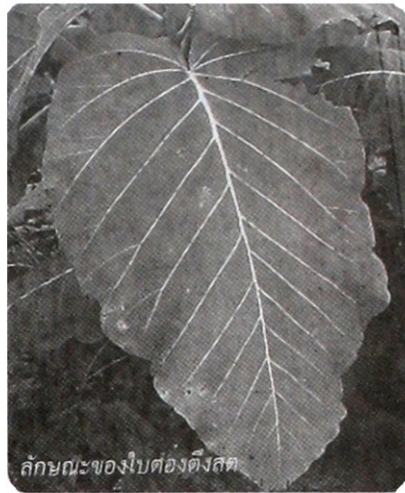
ลักษณะของใบตองตั้งสด

ผลิตภัณฑ์จากใบตองตั้งภายใต้แบรนด์ Mr.Leaf มีหลากหลาย เช่น กระเป๋าทู กระเป๋าใส่นามบัตร กระเป๋าใส่พาสปอร์ต กระเป๋าใส่ยางรัด กระเป๋าใส่ไอแพด กระเป๋าเป้ หมวก ร่ม รูปภาควิดีโม่ กรอบรูป โคมไฟ เสื้อ รวมถึงรองเท้า สินค้าที่ได้รับความนิยมมาก คือ กระเป๋าทู ขายกันในราคาใบละ 450-750 บาท ส่วนสินค้าอย่างอื่นมีราคาตั้งแต่ 120-4,000 บาท โดยสินค้าทุกชิ้นมีอายุการใช้งาน ประเมศร์