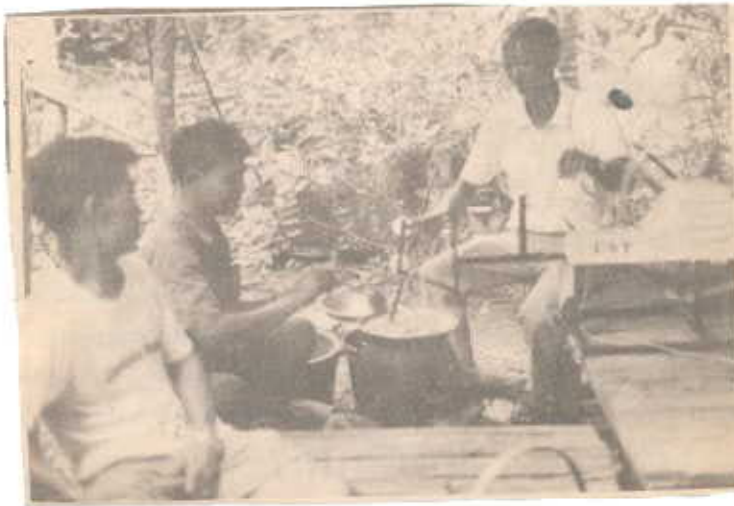
เครื่องตี- เกลียวไหม (หลาขึ้นไหม ไฟฟ้า) ยูเอสที. กำลังตีเกลียว เส้นไหม (เส้น ไหม) โดยไม่ ต้องมีคนดูแล