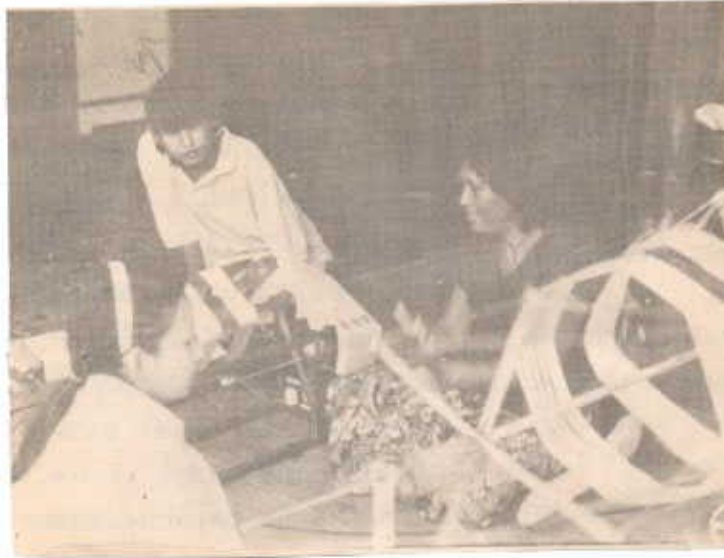
กำลังใช้ เครื่องหมุนอีก ไฟฟ้า ยูเอสที. กวัดไหมออก จากรางเข้าอีก- ไหมเพื่อการนำ ไปเส้นไหมขึ้นทอ (กี่) หรือด้นทมิ เพื่อนำไหมไป ย้อม.