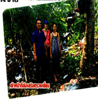
เจ้าหน้าที่ส่งเสริมการเลี้ยง