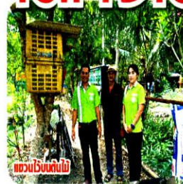
แขวนโบริงต้นไม้