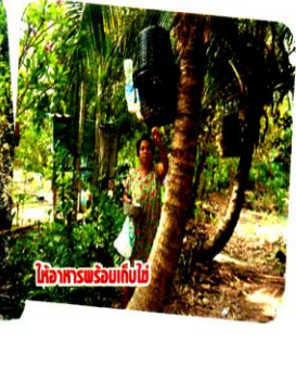
ให้อาหารพร้อมเก็บไข่

สำหรับการสร้างคอกนั้นเกษตรกรจะใช้ไม้หน้า 3 นิ้ว ยาวประมาณ 80 ซม. จำนวน 2 อัน ใช้ตะปูตอกยึดสูงจากโคนต้นมะพร้าวประมาณ 1.5 เมตร หรือระดับที่เก็บไข่และให้อาหารได้สะดวก แล้ววางตะกร้าคอกไก่ทั้ง 2 ข้างบนไม้หน้า 3 นิ้ว คอกก็ใช้ตะกร้าพลาสติก 2 ใบ คว่ำเข้าหากัน สำหรับเลี้ยงไก่ 1 ตัว