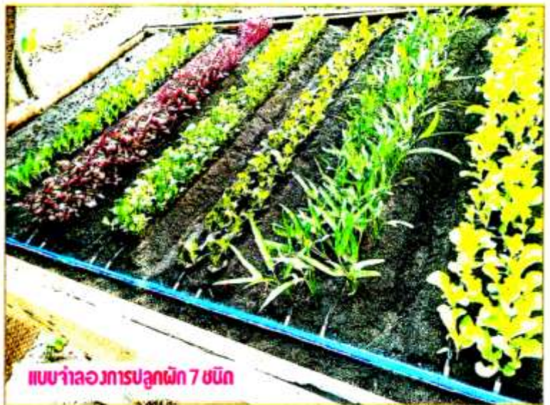
แบบจำลองการปลูกผัก 7 ชนิด