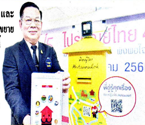
พล.อ.สาธิต พิรรัตนัน

ขณะนี้ได้มอบนโยบายให้แต่ละจังหวัดลงพื้นที่ในเขต อำเภอกองตนเองและส่งเรื่องมายังสำนักงานใหญ่เพื่ออนุมัติเพื่อให้เจ้าหน้าที่ออกแบบให้ตรงตามวัตถุประสงค์ของโครงการ”