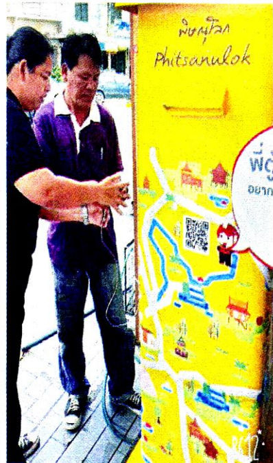
ประชาชนชาร์จแบตเตอรี่ฟรี

ซึ่งปัจจุบันไปรษณีย์มีตู้แดงทั่วประเทศอยู่ที่ 23,185 ตู้