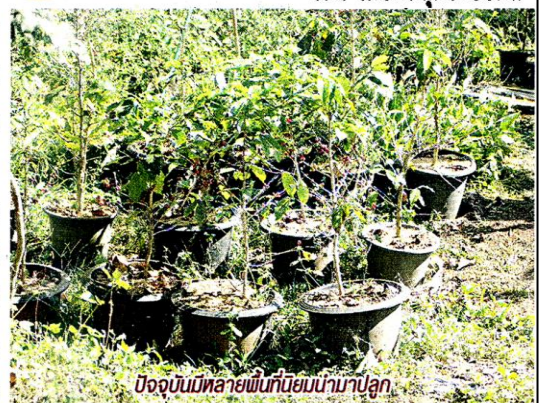
ปัจจุบันมีหลายพันธุ์นิยมนำมาปลูก

กาแฟสามารถนำมาปลูกในกระถางหรือภาชนะได้ เช่นเดียวกับพืชอื่นที่หวังผลให้ออกผลผลิต เช่น มะกรูด มะนาว ตลอดจนถึงมะม่วง ดินที่เหมาะสมสำหรับปลูกกาแฟนั้น โดยเฉพาะการนำมาปลูกในภาชนะควรมีการถ่ายเทอากาศและระบายน้ำได้ดี