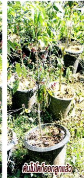
คืนไม้ปักข้อยแล้ว