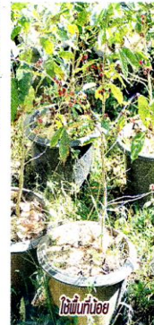
ใช้ไม้ปักข้อย

นำไปวางไว้ในที่มีร่มเงาจากต้นไม้ใหญ่ เมื่อ