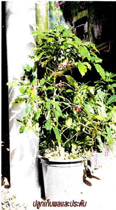
ปลูกเก็บผลและประดับ

ปกติดอกกาแฟจะมีลักษณะเป็นดอกเดี่ยวสมบูรณ์เพศ มีกลีบดอก จำนวน 4-9 กลีบ กลีบเลี้ยง จำนวน 4-5 ใบ มีเกสร 5 อัน รังไข่ 2 ห้อง แต่ละห้องของรังไข่จะมีไข่ 1 ใบ ผลกาแฟจึงมี 2 เมล็ด ดอกกาแฟจะออกเป็นกลุ่ม ๆ บริเวณโคนใบบน ข้อของกิ่งแขนงที่ 1 แขนงที่ 2 หรือ 3 กลุ่มดอกแต่ละข้อมีดอก จำนวน 2-20 ดอก ทั้งนี้ขึ้นอยู่กับ