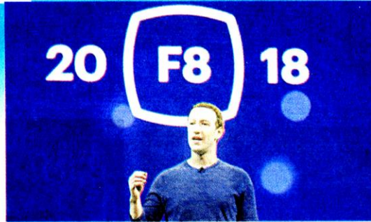
มาร์ก ซักเคอร์เบิร์ก ในงานสัมมนาครั้งใหญ่ F8 Conference ของเฟซบุ๊ก

ซึ่งผู้บริหารของบริษัทเฟซบุ๊กเองก็ยอมรับครับว่า การโจมตีทางข้อมูลข่าวสารเป็นสิ่งที่บริษัทของเขาไม่ได้เตรียมว่าจะเจอหรือเตรียมความพร้อมไม่เพียงพอ ซึ่งต่อจากนี้ทางบริษัทของเขาก็จะมุ่งเน้นที่จะดูแลในเรื่องของข่าวปลอมและความปลอดภัยของข้อมูลผู้ใช้ให้มากยิ่งขึ้น ซึ่งโดยส่วนตัวผมเองก็เห็นว่าสิ่งนี้เป็นสิ่งที่สำคัญมาก ๆ ในยุคสารสนเทศของ โลกศตวรรษที่ 21 และอะไรคือสิ่งที่เฟซบุ๊กกำลังเตรียมความพร้อม รับมือในเรื่องนี้?