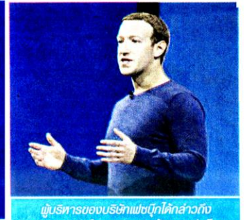
ผู้บริหารของบริษัทเฟซบุ๊กได้กล่าวถึงสถานการณ์ที่ตบสมรภูมิเร้าของเฟซบุ๊กในช่วงต้นปีเรื่องข้อมูลหลุดและข่าวปลอม

ทางเฟซบุ๊กได้มีการเตรียมความพร้อมในเรื่องการตรวจสอบดูแลในเรื่องของข่าวปลอม ตั้งแต่การสร้างความร่วมมือกับองค์กรภายนอกเพื่อตรวจสอบความถูกต้องของเนื้อหาข่าว ไปจนถึงการพยายามหาเครื่องมือตรวจสอบข้อเท็จจริง (Fact Checkers) ของข้อมูลในพื้นที่ที่กำลังจะมีการเลือกตั้ง เช่น ประเทศ เม็กซิโก ประเทศอินโดนีเซีย ประเทศอินเดีย และประเทศฟิลิปปินส์ (อย่างไรก็ดีเขายังไม่ได้กล่าวถึงการเลือกตั้งในประเทศไทย) รวมไปถึงการใช้การเรียนรู้ของเครื่องจักร (Machine Learning) มาช่วยในการตรวจสอบแอดเคาท์ผู้ใช้ปลอม