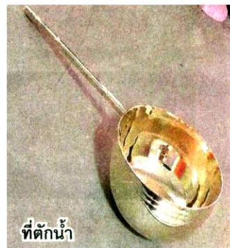
ที่ตักน้ำ

จังหวัดที่มีแหล่งน้ำศักดิ์สิทธิ์ จำนวน 4 แห่ง มี 3 จังหวัด ได้แก่ ปัตตานี ที่ น้ำสระวังปลายบัว บ่อทอง บ่อไชย น้ำบ่อฤๅษี, สุพรรณบุรี ที่สระแก้ว สระคา สระยมนา สระเกษ และแพร์ ที่