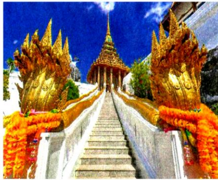
รอยพระพุทธบาท จ.สระบุรี