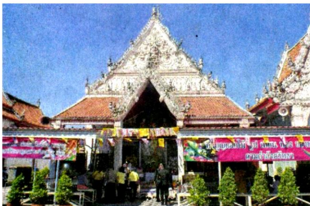
พระวิหารวัดมหาธาตุวรวิหาร จ.เพชรบุรี

สำหรับการพระราชพิธีบรมราชาภิเษกสมเด็จพระเจ้าอยู่หัว ในครั้งนี้ ได้ใช้แหล่งน้ำศักดิ์สิทธิ์ถึง 108 แหล่งน้ำ สำหรับน้ำสรงพระมูรธาภิเษก