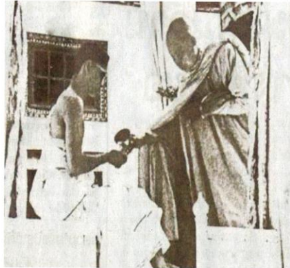
หลังจากทรงสด็จเสวย สมเด็จพระสังฆราชเจ้า (ม.ร.ว.ชื่น นพวงศ์ สุจิตฺโต) ถวายน้ำ พระพุทธมนต์ด้วยครอบอันครบถ้วนที่พระหัตถ์