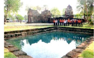
บ่อน้ำปราสาทสระกำแพงน้อย จ.ศรีสะเกษ