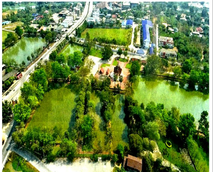
ภาพมุมสูงสระน้ำศักดิ์สิทธิ์ทั้งสี่ในเมืองสุพรรณฯที่ใช้ทำน้ำสรงพระบรมราชาภิเษกและน้ำอภิเษก

นับแต่รัชกาลที่ 1 ถึงรัชกาลที่ 9 มีการประกอบพระราชพิธีบรมราชาภิเษกมาแล้ว 11 ครั้ง