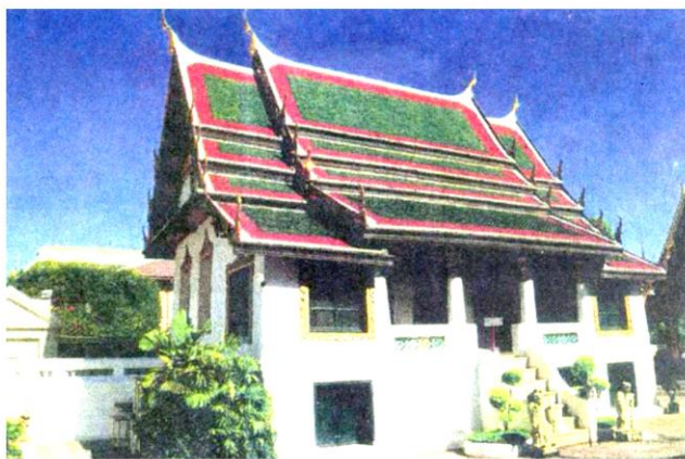
หอศาสตราคม