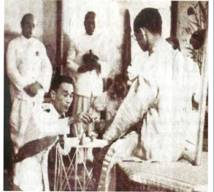
ประทับพระที่นั่งอัฐทิศอุทุมพรราชอาสน์ ภายใต้ฉัตรมงคลเศวตฉัตร ทรงแปร พระพักตร์สูทิศบูรพาเป็นปฐม