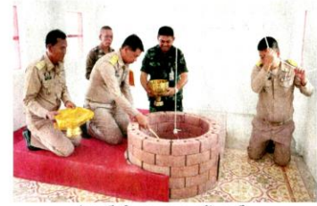
บ่อน้ำ ลำปางมณฑล จ.ปิตคาม

นอกจากน้ำอภิเษกแล้ว ยังมีน้ำสงรมุรธาภิเษก จาก 9 แหล่งน้ำ ประกอบไปด้วย สระศักดิ์สิทธิ์ 4 สระ ของจังหวัดสุพรรณบุรี ได้แก่ สระแก้ว สระคา สระยมนา และสระเกษ นำไปประกอบพิธีเสกน้ำที่ พระวรวิหารหลวงพ่อดโต วัดป่าเลไลยก์วรวิหาร รวมกับน้ำจากแม่ น้ำศักดิ์สิทธิ์ 5 สาย ได้แก่ แม่น้ำบางปะกง ตักที่บึงพระอาจารย์ ทำพิธีเสกน้ำที่วัดอุดมธานี จ.นครนายก, แม่น้ำป่าสัก ตักที่บริเวณบ้านท่าราบ และทำพิธีเสกน้ำที่พระมณฑปรอยพระพุทธบาท วัดพระพุทธบาทราชวรมหาวิหาร จ.สระบุรี, แม่น้ำเจ้าพระยา ตักที่บริเวณปากคลองบางแก้ว