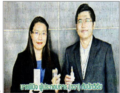
ขายปลีก ผู้ประกอบการ (ขวา) กับนักวิจัย

เอนไซม์คอลลาจีเนสที่ทำให้คอลลาเจนสลายตัวโดยธรรมชาติ ส่งผลให้เพิ่มความยืดหยุ่น