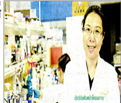
นักวิจัยพัฒนาโครงการ

ซึ่งจากการทดลองสกัดสารสำคัญ และวิเคราะห์ฤทธิ์ทางชีวภาพในลูกชืด ซึ่งพบว่าสารสกัดจากลูกชืดมีฤทธิ์ช่วยยับยั้ง