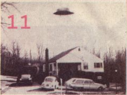
ภาพถ่ายของ วอลฟ์ คิตเตอร์

ทั้งหมดค่อยๆ ดับไปที่ดวงสองดวงจนหมดในจังหวะเดียวกันนั่นเอง