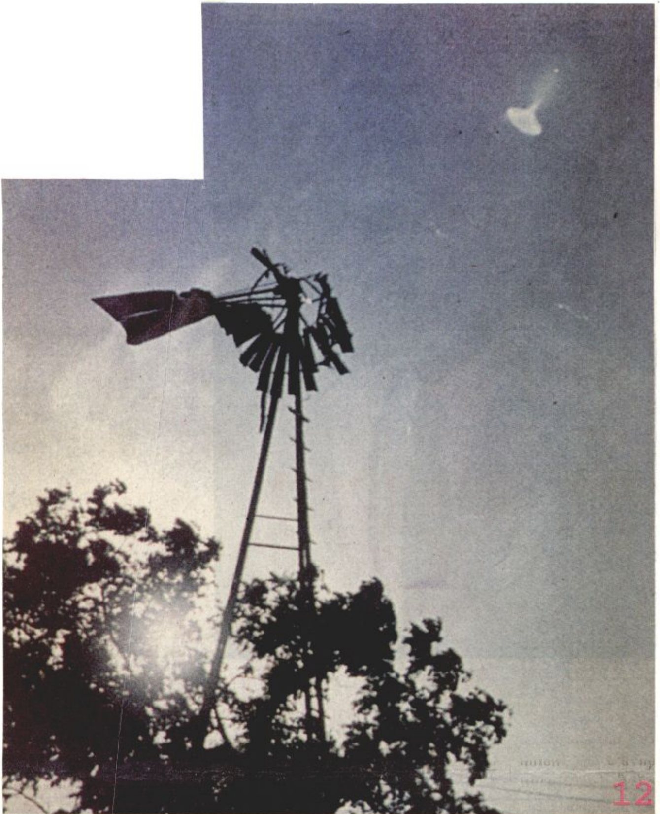
ภาพเหตุการณ์ที่ อิลสคิล เคาน์ตี รัฐมิชิแกน สหรัฐอเมริกา