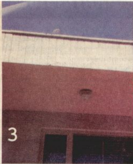
ภาพถ่ายของแฟรงกลิน ดูรี