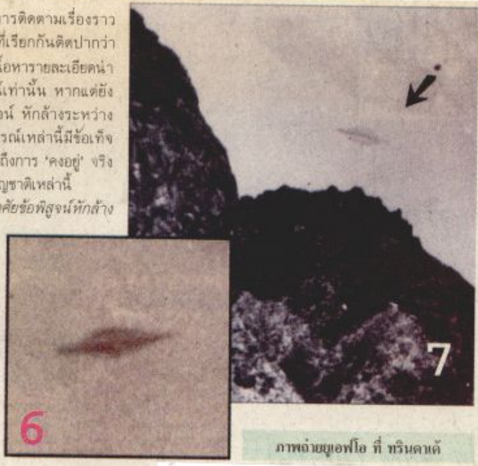
ภาพถ่ายยูเอฟโอ ที่ ทรินดาดี

ผู้ที่วางตัวเป็นกลาง อาศัยข้อพิสูจน์หักล้างทางวิทยาศาสตร์มาเป็นเหตุผลในการเชื่อหรือไม่ย่อมลงความเห็นได้ว่า ส่วนใหญ่ของกรณีที่ปรากฏสู่สาธารณะ ปรากฏการณ์ยูเอฟโอเป็นเรื่องของการเข้าใจผิด เป็นมาตาภาพ ที่เกิดขึ้นจากองค์ประกอบหลายอย่างในห้วงจังหวะเวลาที่เกิดขึ้น ครั้งหนึ่ง บอลลูน