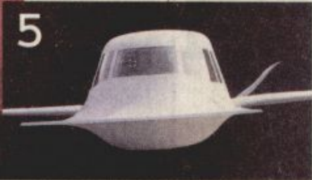
'ทาจิต บดู'