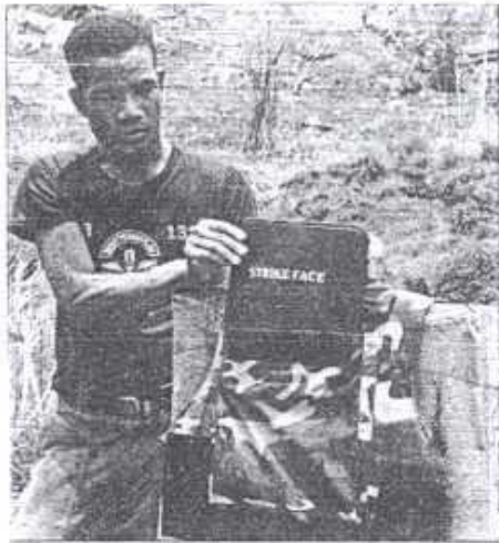
พลิกเพจที่เสริมด้านหน้าทะเล