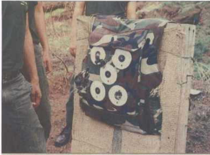
เปรี๊ยะ | กระจุย คมกระสุนจากปืนสั้น เล็ดด้านนอกพรม