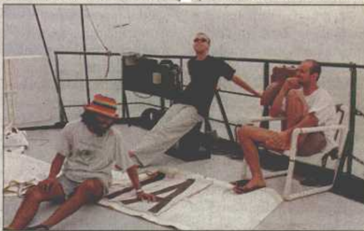
เตรียมทำกิจกรรมกับประมงพื้นบ้านที่สงขลา แต่ลมฟ้าอากาศไม่เป็นใจ เรือไม่สามารถเข้าฝั่งได้

ประเทศไทยมีผู้บริจจาค่วมสองร้อยคน ปัจจุบันกรีนพีซมีอยู่ทั่วโลกกว่า 40 ประเทศ สำนักงานใหญ่ตั้งอยู่ที่ประเทศแอมสเตอร์ดัม และกำลังจะตั้งสำนักงานกรีนพีซในประเทศไทย เหตุผลที่กรีนพีซเป็นที่รู้จักดีในแถบยุโรป และอเมริกา ก็เนื่องมาจากการทำงาน