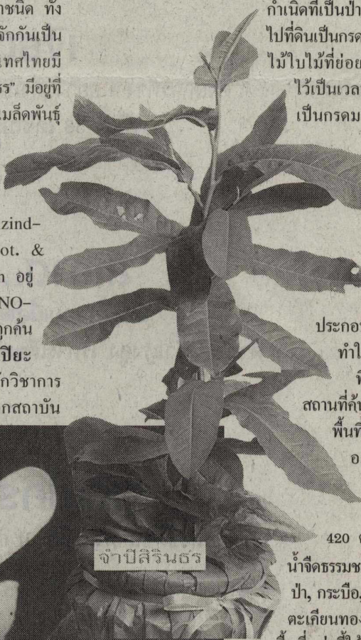
จำปีสิรินธร

สำหรับลักษณะพิเศษที่ทำให้ต่างจากจำปีชนิดอื่น ๆ คือ มีแหล่งกำเนิดที่เป็นป่าพรุมีดินเป็นด่างต่างจากพรุทั่วไปที่ดินเป็นกรด ซึ่งเกิดจากการทับถมของเศษไม้ใบไม้ที่ย่อยสลายไม่หมดและทับถมกันไว้เป็นเวลานาน ทำให้พื้นดินมีลักษณะเป็นกรดมากกว่าด่าง แต่ป่าพรุบริเวณซบจำปาเป็นด่างเพราะดินเกิดจากการที่