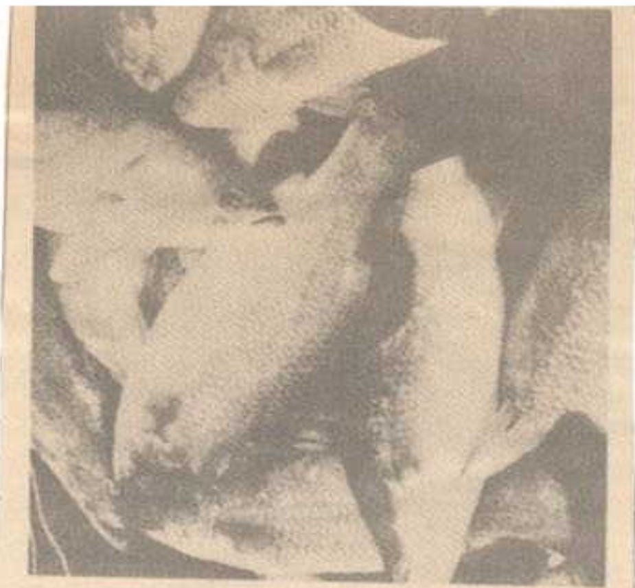
การเลี้ยงปลากระดาษในกระชังในล่อนอายุ ๑ ปี