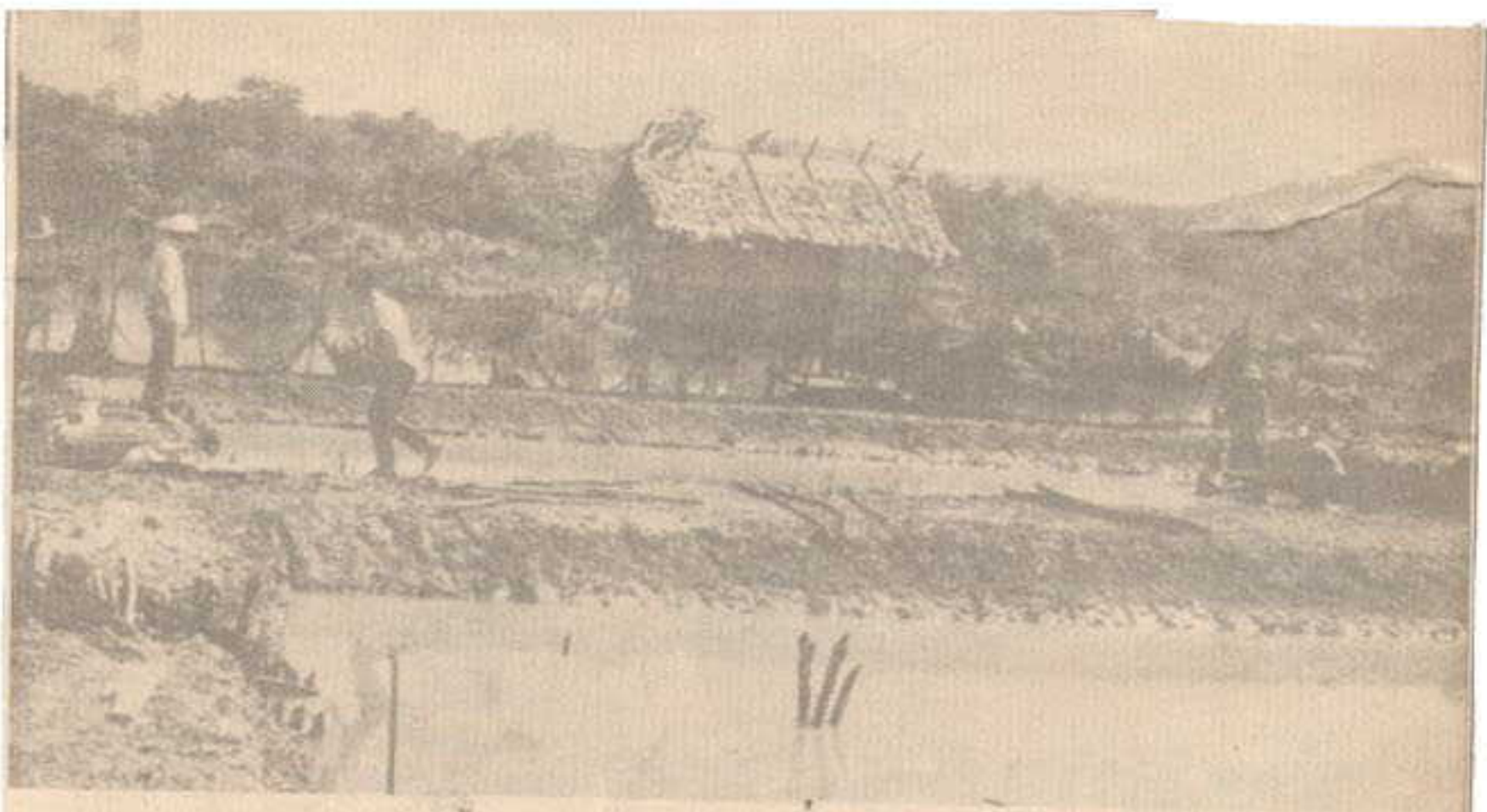
บ่อเลี้ยงปลากระดาษขนาดเล็กในแหล่งน้ำกร่อย

ตลาดมักเข้มาเกาะเหงอกปลากระดาษ และอาจคิดทำรายได้ ในช่องคอกและเขาในอวชะทางเดินอาหาร ทำให้ปลากระดาษ ตาย ทางแก้ไขคือคอยสังเกตเมื่อพบพบขาก็จับออกทิ้ง ตายไป