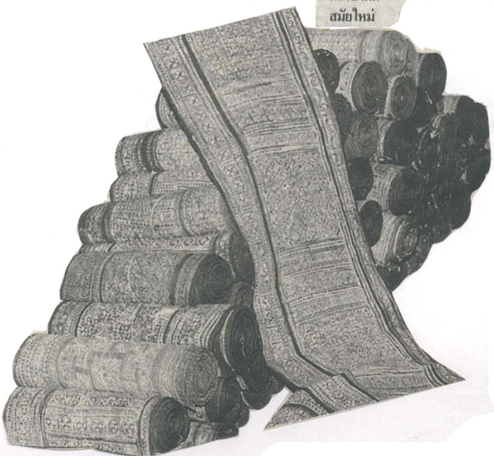
ผ้าใยกัญชงที่เขียนลายเทียนแบบดั้งเดิมมีราคาแพงกว่าบาติกสมัยใหม่

รายได้ ประมาณ 40 ครัวเรือนที่ผลิตและจำหน่ายผ้าใยกัญชง จะมีรายได้โดยเฉลี่ยต่อครัวเรือนเดือนละ