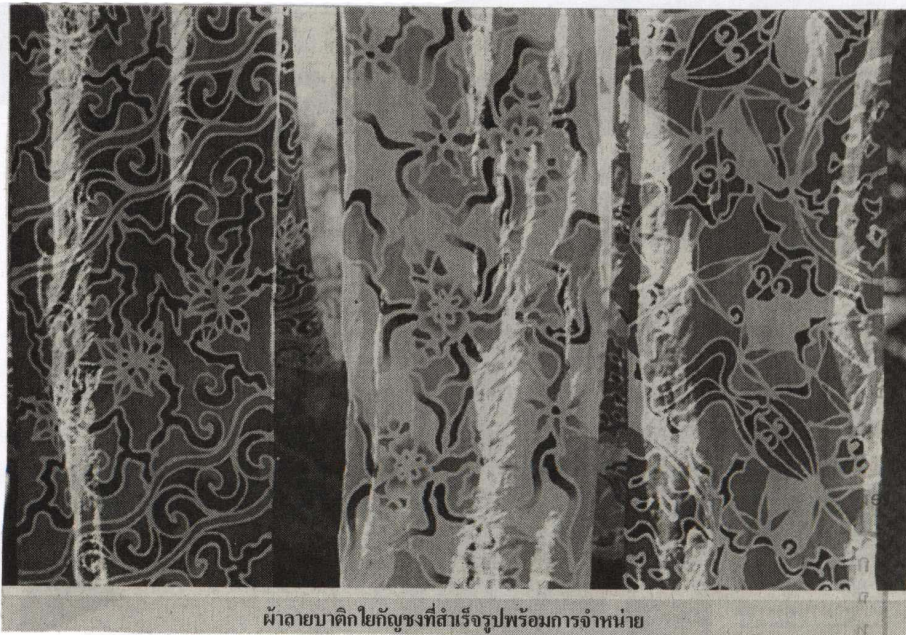
ผ้าลายบาติกใยถักซึ่งที่สำเร็จรูปพร้อมการจำหน่าย