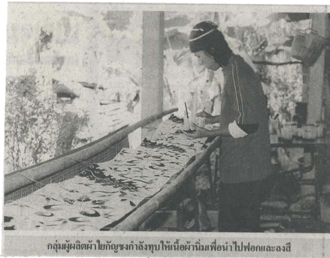
กลุ่มผู้ผลิตผ้าใยกล้วยกำลังทอให้เนื้อผ้านุ่มเพื่อนำไปฟอกและลงสี