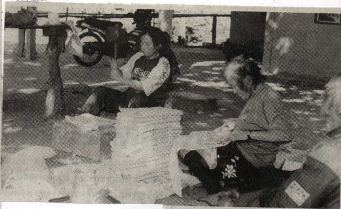
กลุ่มผู้ผลิตผ้าใยถั่วงวงกำลังทบทวนเนื้อผ้าใหม่เพื่อนำไปฟอกและลงสี

สำหรับกองทุนหมู่บ้านที่คนในบ้านคอดยาวรู้ เพื่อช่วยให้นโยบายของรัฐบาลได้ผลตามที่รัฐคาดหวัง ทั้งที่จริงแล้ว รากเหง้าของความเข้มแข็งชุมชนไม่ได้ขึ้นอยู่กับ