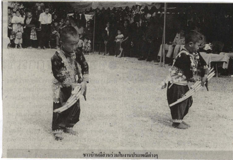
ชาวบ้านมีส่วนร่วมในงานประเพณีต่างๆ