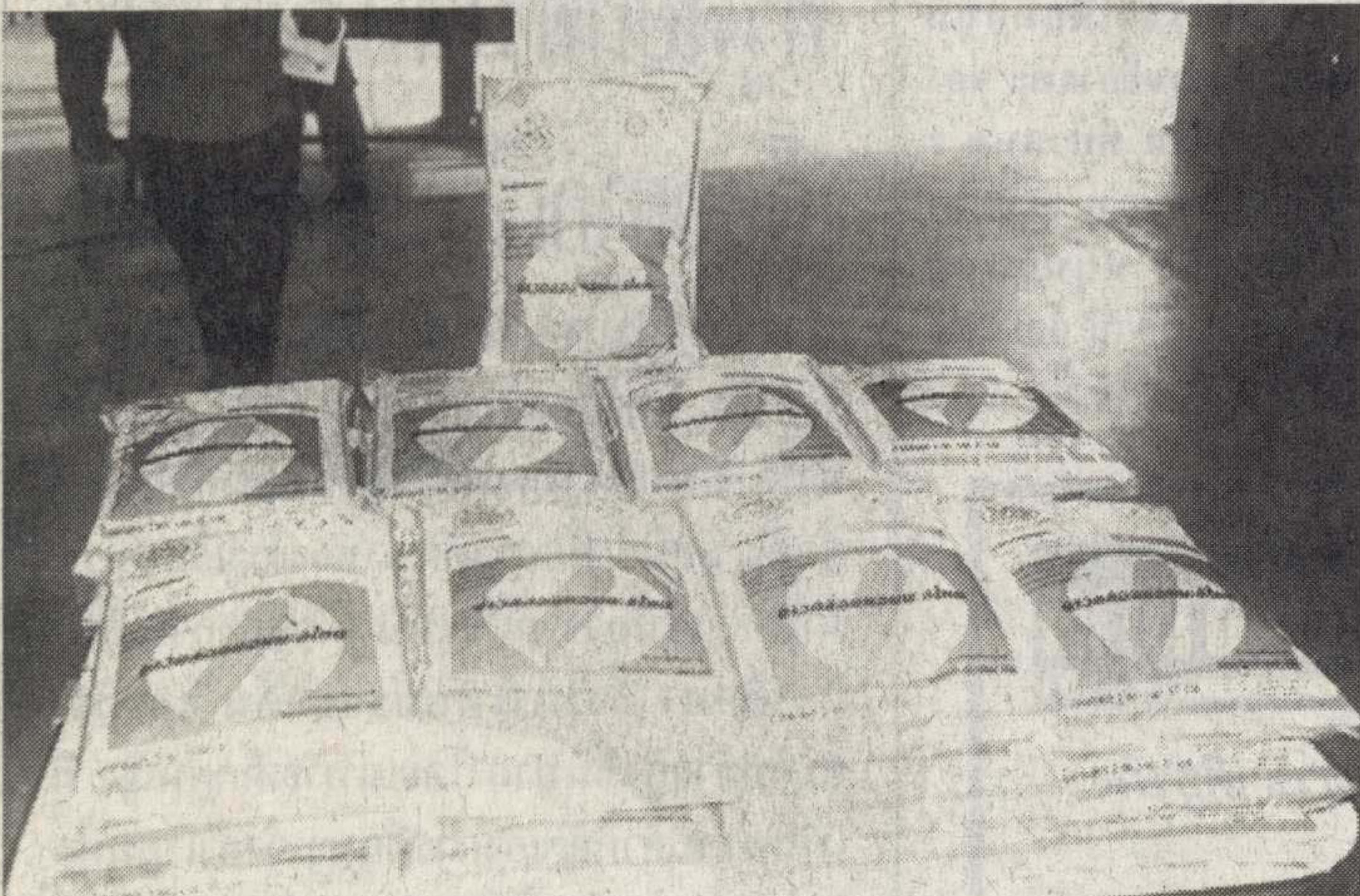
ผลผลิตข้าวกล้องพร้อมจำหน่าย