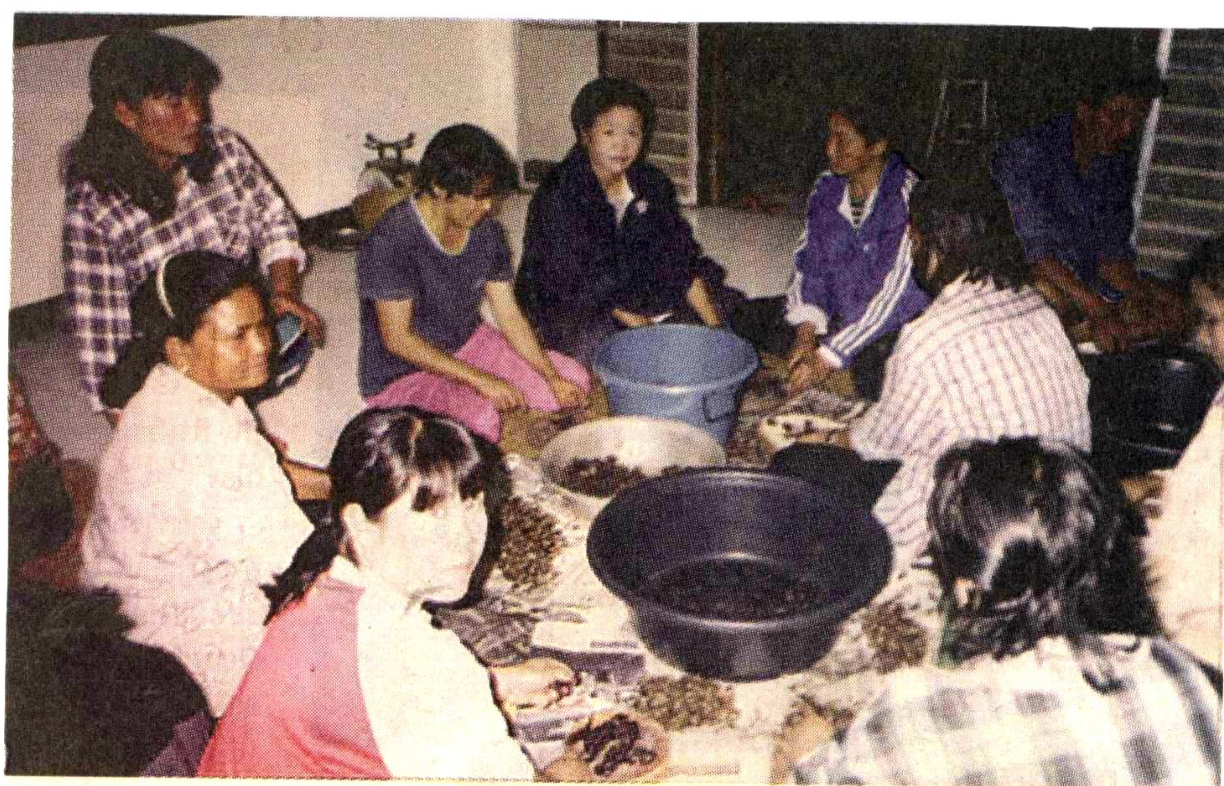
กระบวนการแปรรูปและบรรจุภัณฑ์กระชายดำ กระชายขาว และกระชายแดง ของกลุ่มแม่บ้าน อ.ส.และชาวบ้าน อ.สันติสุข จ.น่าน

กระชายดำก็เป็น 1 ในสมุนไพรซึ่งถือเป็นยาอายุวัฒนะ ชาวไทยภูเขาเชื้อสายม้งนิยมใช้เป็นยาสามัญประจำบ้าน รักษาโรคปวดท้อง แก้ปวดเมื่อย เหนื่อยหอบและหอบหืด สืบทอดกันมานับตั้งแต่บรรพบุรุษแล้ว มีการกล่าวขานกันในหมู่ชาวม้งว่า กระชาย