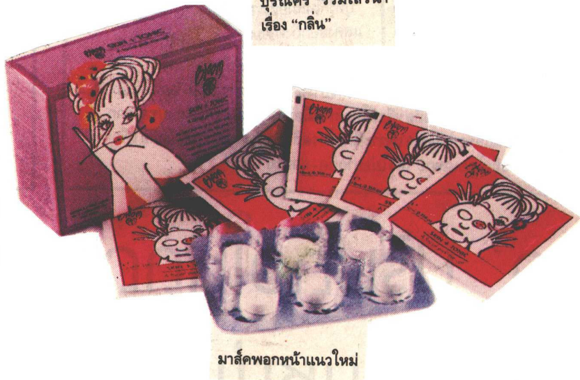
มาสก์พอกหน้าแนวใหม่

การใช้มาสก์ซึ่งมีส่วนผสมของน้ำมันหอมลาเวนเดอร์ ให้กลิ่นสดชื่น ช่วยให้ผ่อนคลาย และเพิ่มความชุ่มชื้นแก่ผิวหน้าและบำรุงผิว สามารถใช้ได้สัปดาห์ละ 1 ครั้ง หรือ 2 สัปดาห์ต่อครั้ง หลังถอดหน้ากาก (มาสก์) ออกแล้ว