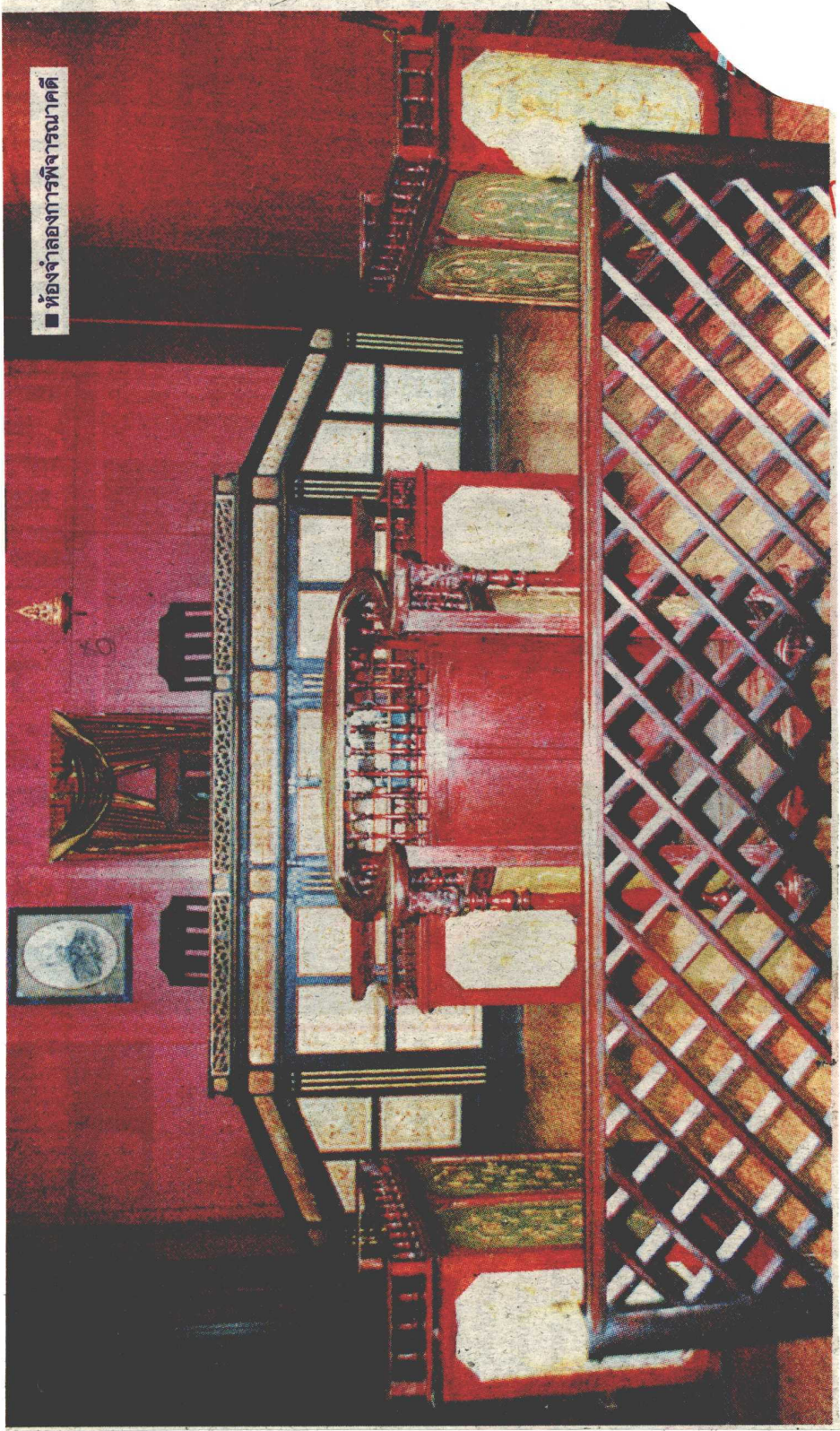
■ ห้องจำลองการพิจารณาคดี