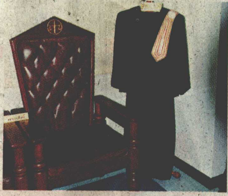
■ ฉลองพระองค์ครุย สมเด็จพระบรมโอรสาธิราชฯ สยามมกุฎราชกุมาร พร้อมเก้าอี้ที่ประทับ โอรสาธิราชฯ สยามมกุฎราชกุมาร เมื่อครั้งเสด็จฯ แทนพระองค์ทรงเปิดอาคารที่ทำการศาลอาญา ถนนรัชดาฯ เมื่อวันที่ 30 มีนาคม 2535

โต๊ะ เก้าอี้ ที่ประทับ, เครื่องตอกเชิดของศาลแพ่ง, เครื่องพิมพ์ดีด สำหรับพิมพ์คำพิพากษา สมัยรัชกาลที่ 5 ฯลฯ อีกด้านหนึ่งเป็นส่วนหนึ่งของพิพิธภัณฑฯ เป็นสถานที่จัดแสดงเรื่องราวความเป็นมาของศาล สติปัญญาธรรม ตั้งแต่สมัยสุโขทัย สมัยกรุงศรีอยุธยา สมัยกรุงธนบุรี และสมัยกรุงรัตนโกสินทร์ โดยใน สมัยสุโขทัย ได้มีการกล่าวถึงหลักฐานที่แสดงถึงการศาลในสมัยนั้นในศิลาจารึก อาทิ การศาลสมัยสุโขทัยนอกจากจะมีพระมหากษัตริย์ หรือพ่อเมืองแล้ว ยังกล่าวถึงอุคตการณั ของขุนศาลที่ทำหน้าที่พิจารณา