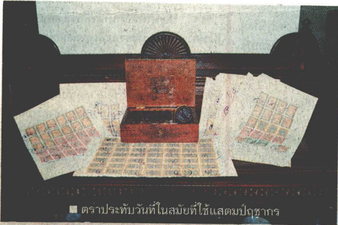
■ ตราประทับวันที่ในสมัยที่ไห้แสดงปฎิชากร