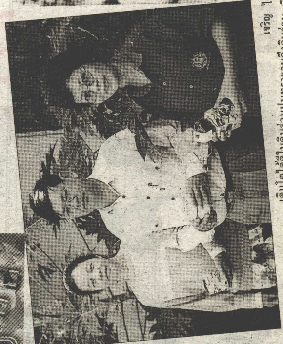
เจียว ได้ไปได้ในคืนร่วมปนพราชมจนถึงดินร่วม เคียว ได้ไปได้ในคืนร่วมปนพราชมจนถึงดินร่วม เคียว ได้ไปได้ในคืนร่วมปนพราชมจนถึงดินร่วม

"ปอโมโรเฮยะ" ปอที่ได้ในทุกพื้นที่ของ ประเทศไทยและเกษตรกรสามารถนำไปปลูกเป็นพืช ผักสวนครัวได้ แต่ดูถูกปลูกที่เหมาะสมจะอยู่ในช่วง เดือนพฤษภาคม-สิงหาคม ถ้าปลูกก่อนหรือหลังช่วง นี้ ต้นปอจะมีการเจริญเติบโตทางด้านต้นน้อย ออกดอก เร็ว ใบเล็กและจะให้ผลผลิตต่ำ ปอชนิดนี้