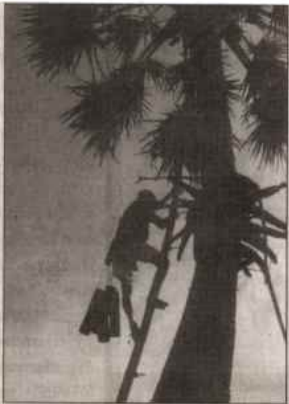
▲ ชาวบ้านจะปีนขึ้นต้นตาลใบตอนเย็น เอากระบอกไม้ไผ่ไปรองน้ำตาลไว้รุ่งเช้า ค่อยขึ้นไปเก็บ

น้ำตาลเมา ทำจากน้ำตาลหวานจากต้นตาล นำมาหมักกับดินและเกลือ ซึ่งมีรสขมทำให้ออกมาเป็นรสหวานอมขม หอมบริสุทธีไม่มีสารสังเคราะห์ใดเจือปน เป็นแบบธรรมชาติแท้ ๆ ซึ่งอาจทิ้งไว้ให้บูดเปรี้ยวขึ้นเองหรือใส่หัวเชื้อลงไปช่วยให้เกิดการย่อยสลายเป็นแอลกอฮอล์ขึ้นเมา ด้วยรสและกลิ่นที่หอมปน