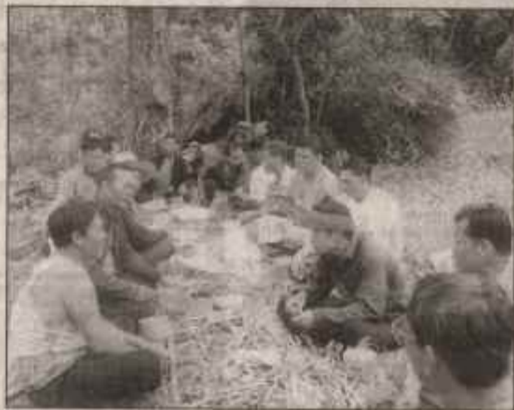
▲ ชาวบ้านท้องถิ่นร่วมวงกันสังสรรค์ดื่มน้ำตาลเมาจากโอกาสเพื่อการจับมือสมัครเล่น