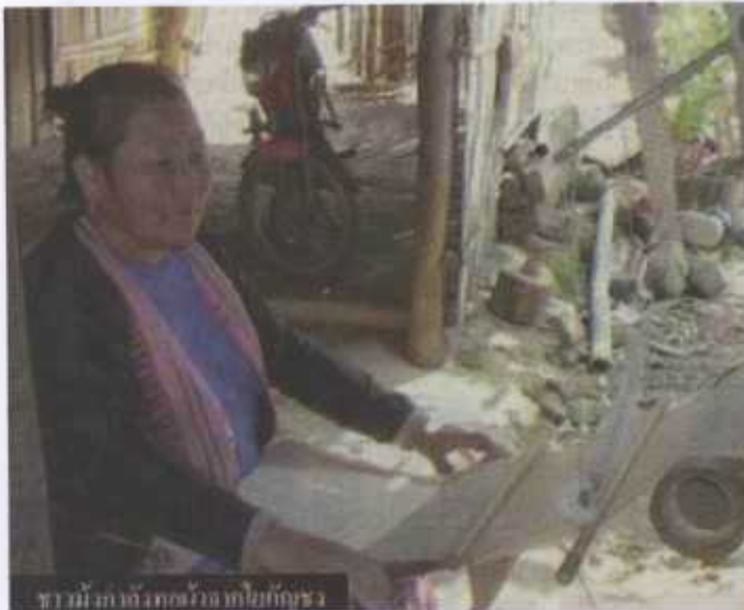
ชาวม้งกับรถเข็นขายกัญชง