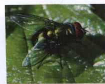
แมลงวันกันเขียว

ใช้หนอนบำบัดที่โรงพยาบาลหลายแห่งในกรุงเทพฯ ส่วนในต่างจังหวัดก็มีโรงพยาบาล อ.จอมทอง จ.เชียงใหม่ เพียงแห่งเดียว วิธีการนำไข่ คือ การนำไข่ของแมลงวันกันเขียวใส่ไว้ในผ้าปิดแผล และเพาะให้เป็นหนอนเมื่อหนอนออกจากไข่แล้วจะมีวงจรชีวิตประมาณ 3-4 วัน ก่อนจะกลายเป็นดักแด้ ดังนั้น ในการบำบัดแต่ละครั้งจึงต้องเปลี่ยนผ้าปิดแผลทุก 3 วัน และเมื่อไข่เสร็จแล้วต้องกำจัดทิ้งภายใน 5 วัน เพราะหลังจากนั้นประมาณ 7 วัน จากดักแด้ก็จะกลายเป็นแมลงวัน แต่ถึงแม้จะไม่ได้กำจัดภายใน 5 วัน ก็ไม่ต้องกลัวว่าจะมีแมลงวันกันเขียวในสิ่งแวดล้อม เพราะแมลงวันชนิดนี้เป็นแมลงวันเมืองหนาว อยู่ใน