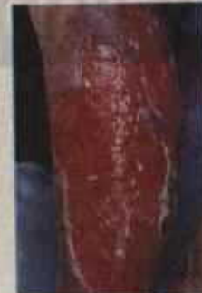
แผลหลังการรักษา