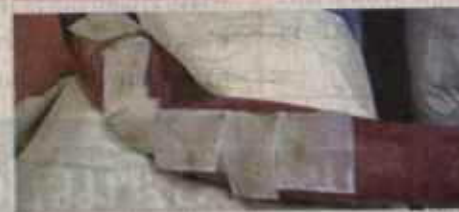
วิธีการรักษาด้วยดูหนอนแมลงวัน