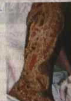
แผลก่อนการรักษา