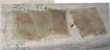
ดูหนอนแมลงวัน

ใช้ยา ประวัติการรักษาด้วยหนอนบำบัดนั้น เริ่มเมื่อกว่าพันปีมาแล้ว พบว่า Mayas ประเทศออสเตรเลีย มีความรู้ในการใช้หนอนแมลงวันเพื่อรักษาบาดแผล ส่วนในยุโรปก็มีการใช้หนอนบำบัดครั้งแรกเมื่อต้นศตวรรษที่ 19 และที่อเมริกามีการใช้หนอนบำบัดครั้งแรกเมื่อปี พ.ศ.2471 สำหรับเมืองไทยเริ่มนำเข้าสู่สายพันธุ์แมลงวันกันเขียวจากเยอรมนีเป็นครั้งแรกเมื่อปี พ.ศ.2547 โดยบริษัท ไบโอมอนด์ นำเข้ามาเป็นครั้งแรก และเพาะเลี้ยงภายในห้องแล็บ โดยทำการผลิตเป็นผ้าปิดแผลสมุนไพรธรรมชาติ จัดเป็นสมุนไพรและกลุ่มแพทย์ทางเลือก โรงพยาบาลที่จะใช้ต้องสั่งผลิตจากห้องแล็บก่อนซึ่งในแต่ละเดือนจะมีคนไข้ที่ใช้การรักษาแบบหนอนบำบัดประมาณ 3-4 ราย และขณะนี้มีการ