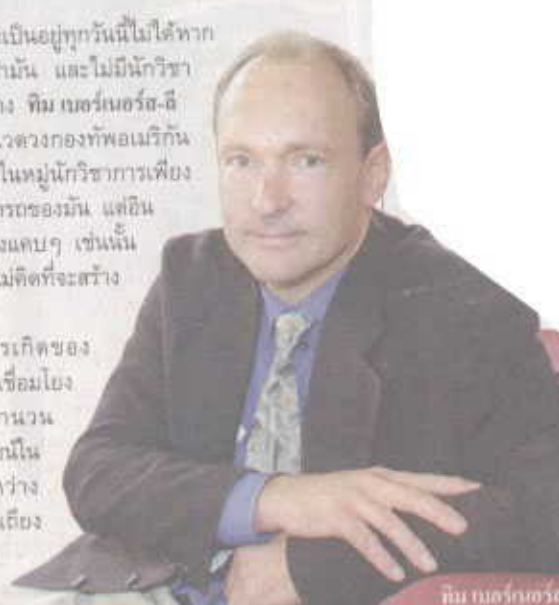
ทิม เบอร์เนอร์ส-ลี

วันที่ 5 สิงหาคม 1991 เมื่อ 15 ปีก่อน ทิม เบอร์เนอร์ส-ลี เขียนโปรแกรมขึ้นมาตัวหนึ่ง ใ้ทำหน้าที่เชื่อมโยง และ บรรวช้ เครือข่ายอินเทอร์เน็ตนี้ได้เป้าหมายของซอฟต์แวร์ของเขาก็คือ ให้เราสามารถเชื่อมโยงกับข้อมูลข่าวสารทุกชิ้นได้ในทุกที่ทุกเวลา และต้องขอบคุณความกรุณาของนักวิชาการชาวอังกฤษผู้หนึ่งที่ปล่อยให้ข้อมูลของซอฟต์แวร์ทั้งหมดของตนเองเปิดกว้าง ให้ทุกคนสามารถลอกเอาไปใช้ในการคิดค้นพัฒนาต่อได้ ไม่เช่นนั้นก็คงไม่เกิดการพัฒนารวดเร็วเช่นทุกวันนี้