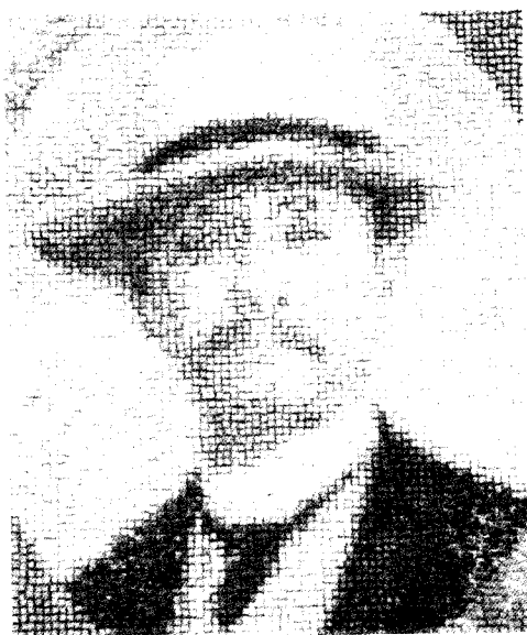
* ภาพเหมือนด้วยเม็ดดินสอ (CERAMIC) เลียนแบบการปักผ้าครอสติช พระบรมฉายาลักษณ์ สมเด็จพระปียมหาราช

การจัดทำภาพเหมือนด้วยเม็ดดินสอ (CERAMIC) (เลียนแบบการปักผ้าครอสติช) นี้ ขึ้นคอนและวิธีการทำค่อนข้างยุ่งยากและละเอียด ในการวิจัยสีให้ได้สีเหมือนหรือใกล้เคียงกับสีไหมปักผ้า การนำเม็ดสีที่วิจัย