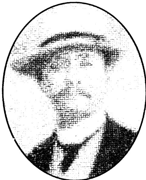
ภาพเหมือนลายปักครอสติช พระบรมฉายาลักษณ์ สมเด็จพระปียมหาราช