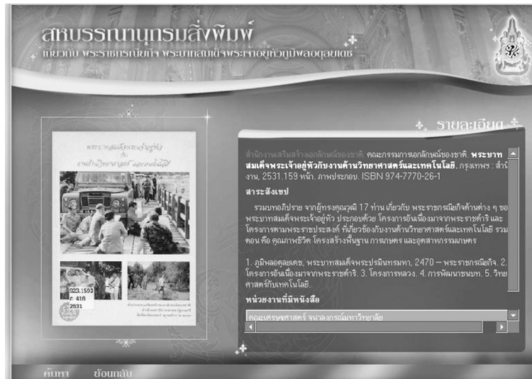
ภาพที่ 3 ผลการค้นข้อมูลผ่านทางเว็บไซต์