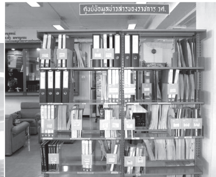
ศูนย์บริการข้อมูลข่าวสาร ของราชการ วศ. ณ อาคารสำนักหอสมุดฯ (ชั้น 5)