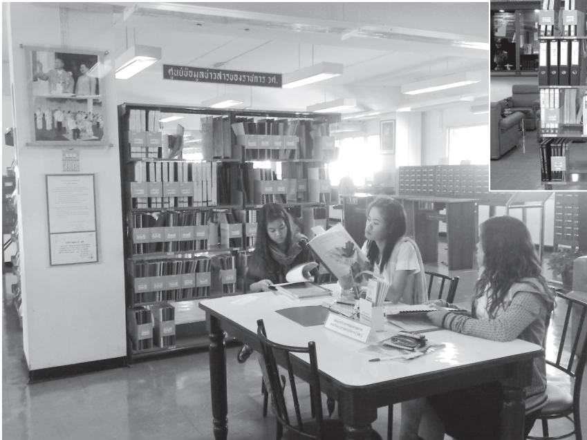
ผู้ใช้บริการสามารถค้นด้วยตนเองได้สะดวก