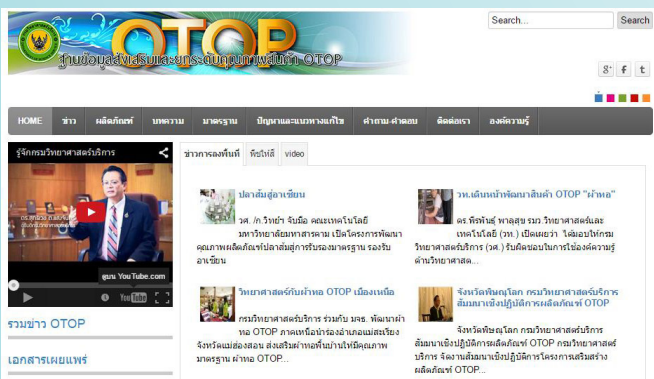
ภาพที่ 1 แสดงหน้าเว็บไซต์ฐานข้อมูลส่งเสริมและยกระดับคุณภาพสินค้า OTOP