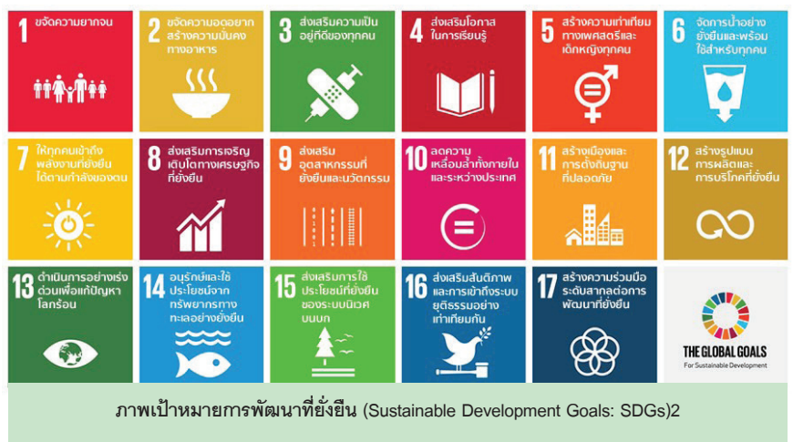
ภาพเป้าหมายการพัฒนาที่ยั่งยืน (Sustainable Development Goals: SDGs)2

จะต้องมีบทบาทร่วมกัน ดังประโยคสั้นๆ ที่พวกเราจะได้ยินอยู่บ่อยครั้งจากผู้นำประเทศว่า “ไม่ทิ้งใครไว้ข้างหลัง” ประเทศไทยและประเทศสมาชิกสหประชาชาติได้ร่วมลงนามรับรองวาระการพัฒนาที่ยั่งยืน พ.ศ. 2573 (2030 Agenda for Sustainable Development) อันเป็นกรอบการพัฒนาด้านสังคม เศรษฐกิจ และสิ่งแวดล้อม โดยกำหนดเป้าหมายการพัฒนาที่ยั่งยืน (Sustainable Development Goals: SDGs) เพื่อเป็นแนวทางการพัฒนาสำหรับทุกประเทศ ประกอบด้วย 17 เป้าหมาย ตามภาพที่ 1 เป้าหมายการพัฒนาที่ยั่งยืน (Sustainable Development Goals: SDGs)