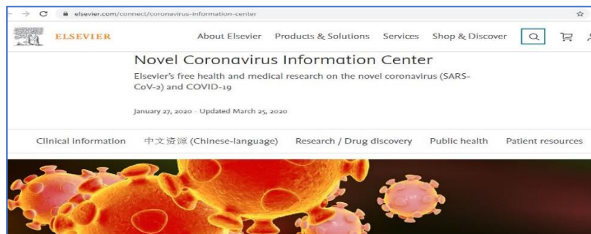
Elsevier Coronavirus Information Center