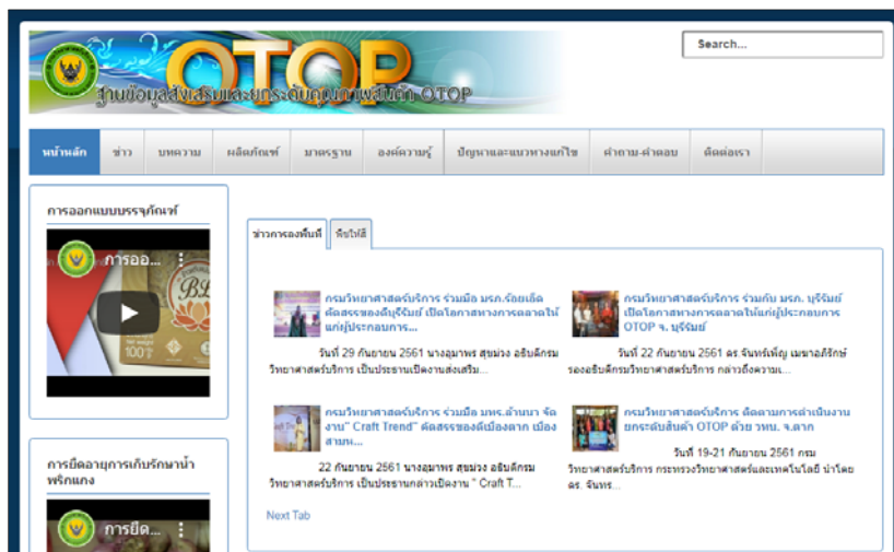
ภาพที่ 1 แสดงหน้าเว็บไซต์ฐานข้อมูลส่งเสริมและยกระดับคุณภาพสินค้า OTOP

องค์ความรู้ทางด้านวิทยาศาสตร์และเทคโนโลยีนั้นเป็นหนึ่งพื้นฐานสำคัญของการพัฒนาผลิตภัณฑ์ชุมชน แต่ปัจจุบันพบว่ายังไม่มีช่องทางในการเข้าถึงสารสนเทศ หรือองค์ความรู้ทางด้านวิทยาศาสตร์และเทคโนโลยีที่เกี่ยวข้องกับผลิตภัณฑ์ OTOP ในรูปแบบออนไลน์หรือเว็บไซต์ จึงนำมาสู่แนวคิดในการพัฒนาเว็บไซต์/ฐานข้อมูลทางด้านวิทยาศาสตร์และเทคโนโลยีของผลิตภัณฑ์ OTOP ขึ้น