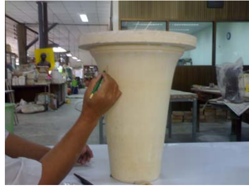
2. ร่างแบบลงบนดินแบบตามต้องการ