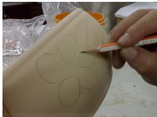
2. ร่างแบบลงบนต้นแบบตามต้องการ