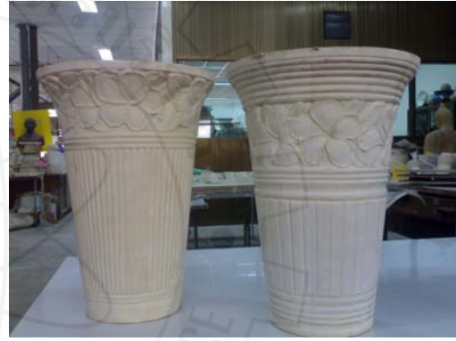
3. ใช้เครื่องมือ WOODCUT KNIFE แกะเส้นรอบ 4. ดินแบบปูนปลาสเตอร์ที่แกะเรียบร้อยแล้ว นอกของดอกและใบให้ทั่วทั้งหมด