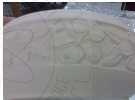
3. ใช้เครื่องมือ WOODCUT KNIFE แกะเส้นรอบนอกของดอกและใบให้ทั่วทั้งหมด