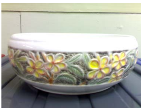
5. ผลิตภัณฑ์เซรามิกที่ทำการตกแต่งเรียบร้อยแล้ว