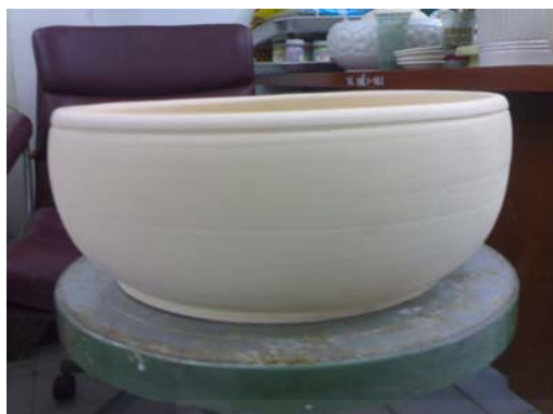
1. ผลิตภัณฑ์เซรามิกดิบ