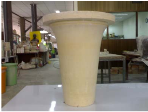
1. ดินแบบปูนปลาสเตอร์