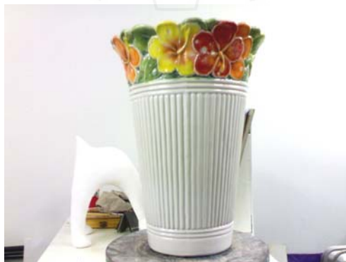
5. ผลิตภัณฑ์เซรามิกที่ทำการตกแต่งเรียบร้อยแล้ว