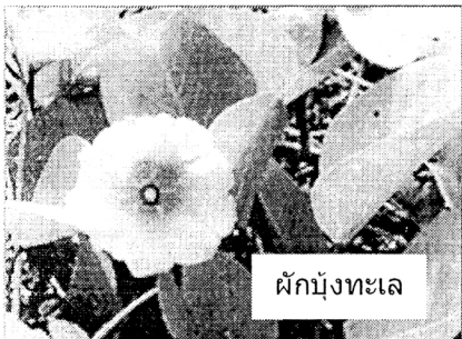
ฝักนึ่งทะเล

มาทำความรู้จักต้นตะไคร้ภูเขากันก่อน ไม้ชนิดนี้เป็นไม้ยืนต้นสูงใหญ่ จะขึ้นบนภูเขาเท่านั้น สูงกว่าระดับน้ำทะเล 700 เมตรขึ้นไป ในประเทศไทยพบที่เชียงราย แม่ฮ่องสอน เชียงใหม่ที่แม่จัน และที่เขาค้อ ส่วนชิงเฮาเป็นไม้ล้มลุก ไม่จำเป็นต้องปลูกที่สูง ปลูกได้ที่เชียงราย และกาญจนบุรี ทั้งนี้ จะเน้นวัตถุดิบที่มีในประเทศไทย ผลิตมาได้ 3 ปีแล้ว มีทั้งหลอดเล็ก-หลอดใหญ่-ราคา 50 และ 90 บาท มีวางขายที่คณะเวชศาสตร์เขตร้อนฯ