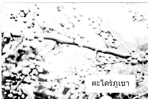
ตะไคร้ภูเขา

ลูกประคบให้แก่มุขชนต่างๆ ทั้งที่แม่ฮ่องสอน ดาก และกาญจนบุรี ซึ่งชาวบ้านสามารถนำไปประกอบอาชีพได้ โดยเฉพาะน้ำมันไพล และน้ำมันงาอะโรมามะกรูด บางส่วนทำเป็นสินค้าโอท็อป อย่างเช่นที่แม่ฮ่องสอน มีการตั้งกลุ่มเป็นรัฐวิสาหกิจชุมชน ปรากฏว่าขายดีมาก ทำให้ชาวบ้านยิ้มตาอำปากได้