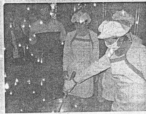
ขั้นตอนการต้มแชมพูและครีมนวดผม

ลักษณะทั่วไป อะโวคาโด ลักษณะผลกลมและผลรีรูปไข่ขนาดใหญ่ น้ำหนักประมาณ 150-200 กรัม เปลือกผลหนาและขรุขระ ผลแก่และสุกจะเป็นสีม่วงหรือเปลือกนิ่ม เมล็ดมี