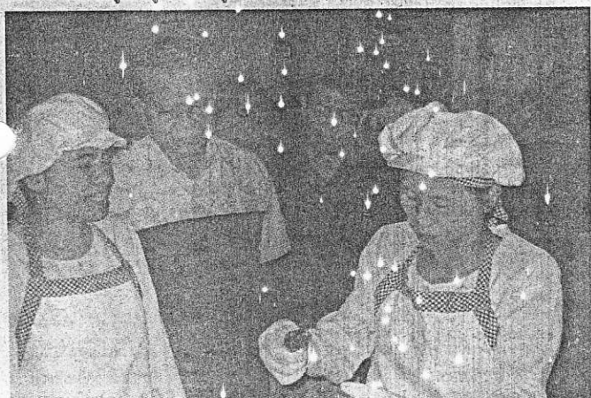
นายธงชาติ รักษากุล อธิบดีกรมส่งเสริมการเกษตรเยี่ยมกลุ่มแปรรูปแชมพูและครีมนวดผมอะโวคาโดบ้านแม่ขนิลเหนือ

ผู้สนใจสั่งซื้อหรือขอทราบข้อมูลเพิ่มเติมได้ที่ กลุ่มแม่บ้านเกษตรกรบ้านแม่ขนิลเหนือ หมู่ที่ 6 ตำบลบ้านปาง อำเภอหางดง จังหวัดเชียงใหม่ โทร. (07) 172-4238, (09) 561-0078, (09) 850-0662 ศูนย์ส่งเสริมการเกษตรที่สูงห้วยผึ้ง โทร. (053) 248-410, (01) 027-8730 ศูนย์พัฒนาโครงการหลวงห้วยผึ้ง โทร. (053) 248-421 และองค์การบริหารส่วนตำบลบ้านปาง โทร. (053) 365-352