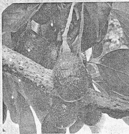
รูปผลอะโวคาโด

อาหารที่มีประโยชน์ต่อร่างกาย ในต่างประเทศเรียกว่า "สุดยอดอาหารสุขภาพ" และแนะนำให้ทุกเพศทุกวัยบริโภค โดยเฉพาะผู้สูงอายุ ผู้ป่วย เด็ก นักกีฬา เนื่องจากอะโวคาโดมีคุณค่าทางอาหาร ประกอบด้วยพลังงานสูงแต่น้ำตาลต่ำ ดังนั้น ผู้ป่วยโรคเบาหวานสามารถบริโภคได้ น้ำ ไขมันประเภทไม่อิ่มตัวจึงมีประโยชน์ต่อร่างกาย และไม่มีคอเลสเตอรอล ดังนั้น เมื่อบริโภคจึงไม่ทำให้อ้วน อีกทั้งมีเส้นใย น้ำตาล แป้ง แร่ธาตุ กรดอินทรีย์ วิตามิน A, B, C และวิตามิน E โดยเฉพาะวิตามิน E สามารถนำมาเป็นวัตถุดิบในการสกัดน้ำมันเพื่อทำแชมพูและครีมนวดผม เครื่องสำอางประเภทผิวชนิดต่างๆ