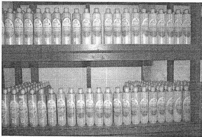
ผลิตภัณฑ์ประเภทยา