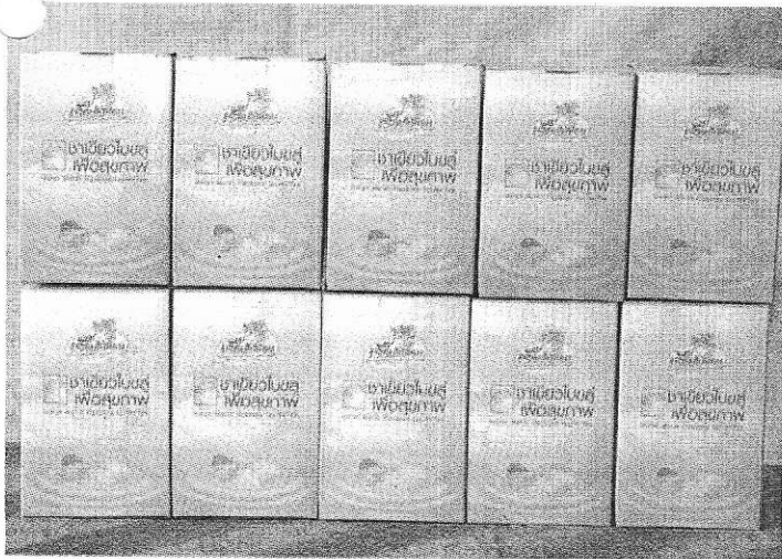
ชาเขียวใบชา

ทำเป็นผลิตภัณฑ์ของตนเอง จะอยู่พักหนึ่งที่กลุ่มก็ได้ เพราะทางกลุ่มเปิดเป็นโฮมสเตย์อำนวยความสะดวกให้กับผู้ที่สนใจจะมาเรียนรู้กันอย่างเต็มที่เลยทีเดียว